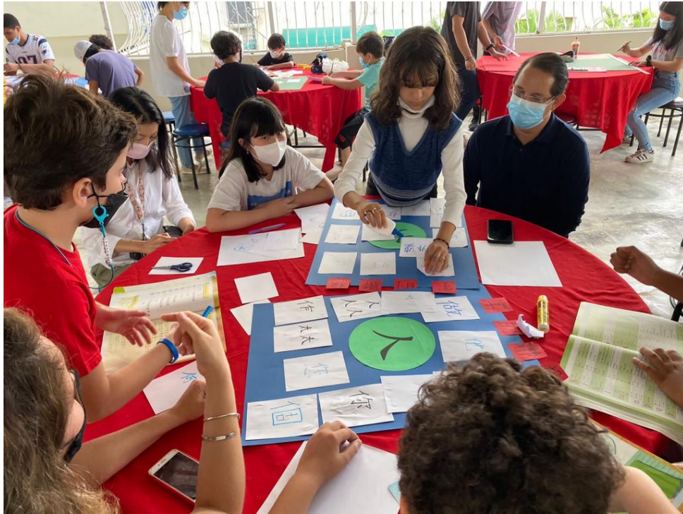
多明尼加臺灣商會附屬中文學校2022漢字文化節活動3