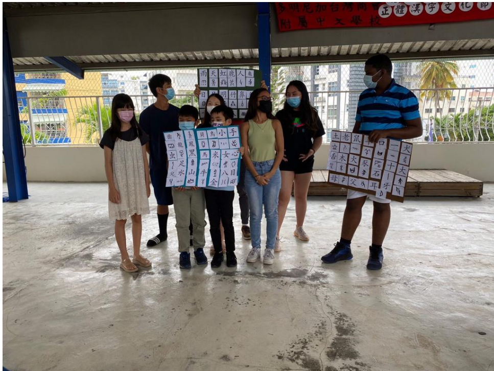
多明尼加臺灣商會附屬中文學校2022漢字文化節活動1

多明尼加臺灣商會附屬中文學校於2022年五月二十一日舉行由求委會補助的漢字文化節活動，邀請學生及家長共約70人參加。由不同班級的老師帶領不同程度的學生進行分組活動，活動內容為「字的家族」、「字的聯想」、「漢字小時候」、「給媽媽的話」及「給媽媽的祝福」及各項漢字遊戲。讓學生和家長藉由參與的過程，認識漢字的部件，漢字的演變，漢字組合成句、成篇的各種風貌，並將成品用不同的方式呈現，不僅展現學生的學習成果及創意，更能體會中華文化之意涵。