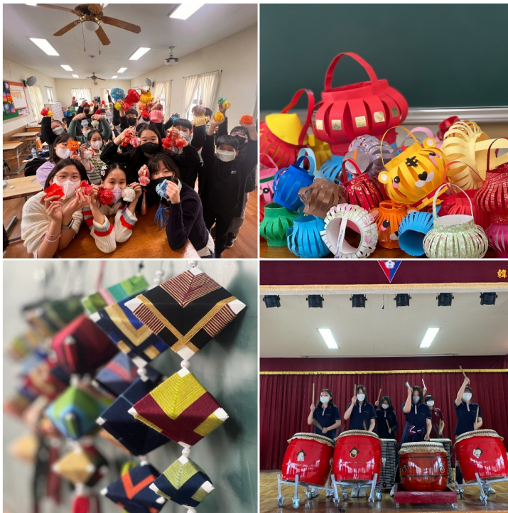
韓國仁川華僑中山中小學慶祝僑委會90週年暨2022年正體漢字文化節系列活動1

韓國仁川華僑中山中小學由衷地感謝中華民國僑委會及駐韓臺北代表部多年來對本校僑教上長期的關心與協助。