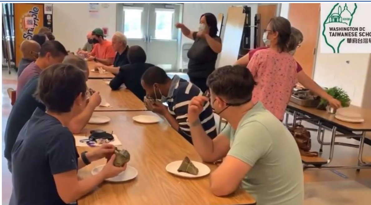
華語文中心學員吃南部粽、北部粽、以及醃粽。