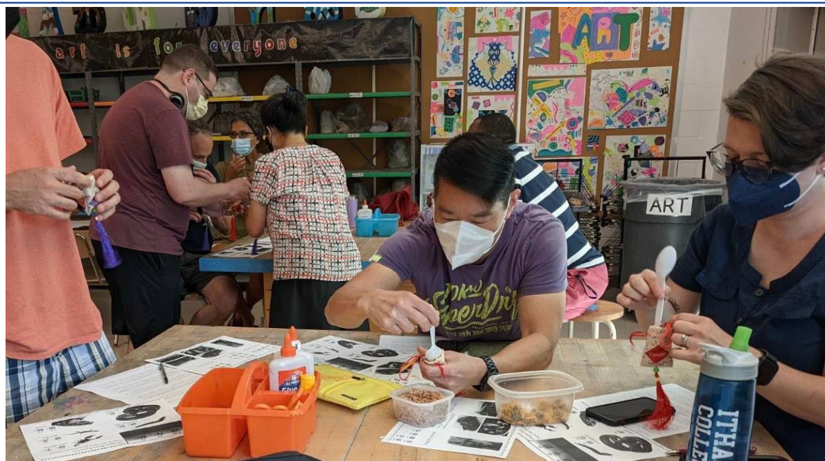
華語文中心學員手作香包。