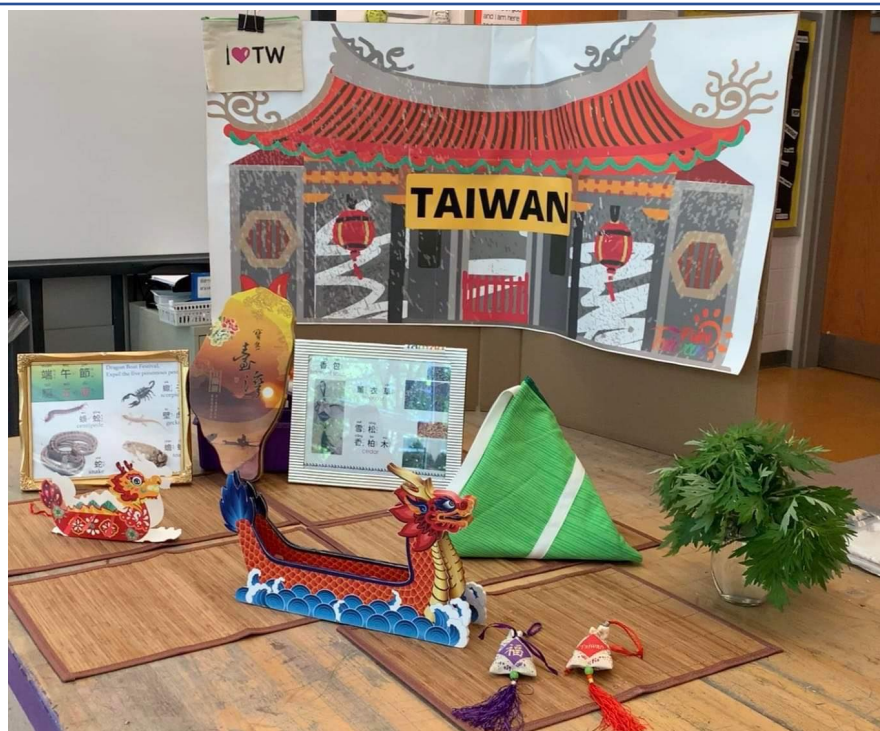
端午節不可或缺的習俗。