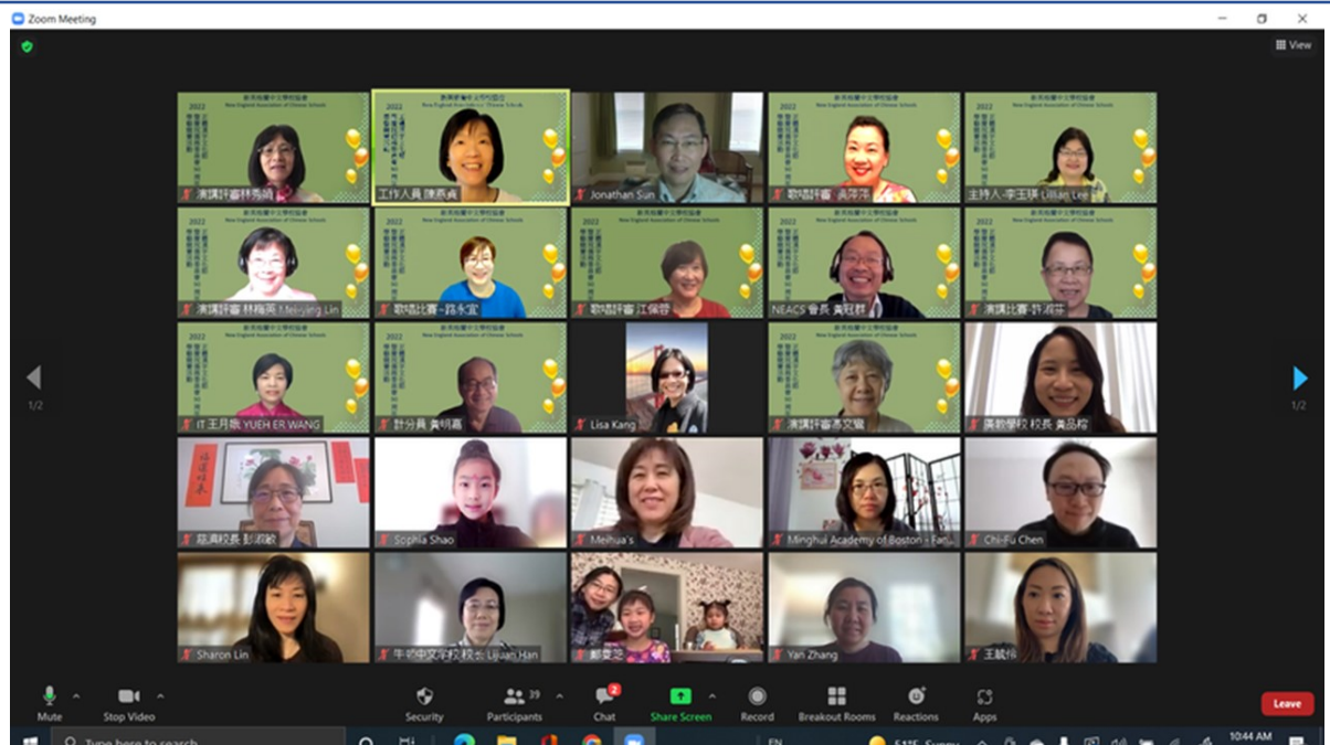
頒獎典禮與會人士合照