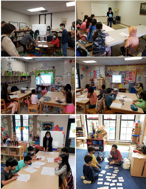
教務向家長評審們解說評分方式和標準。各班學生老師們在檢定比賽開始前把握時間複習字詞