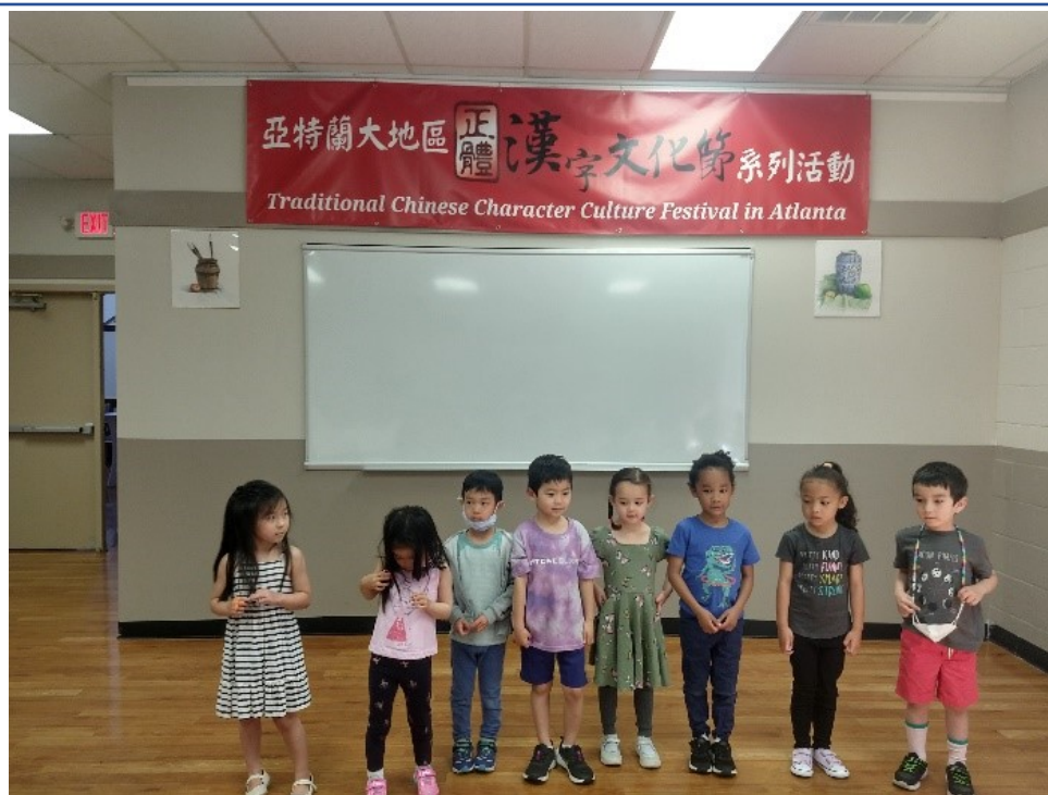
幼幼班團體比賽中