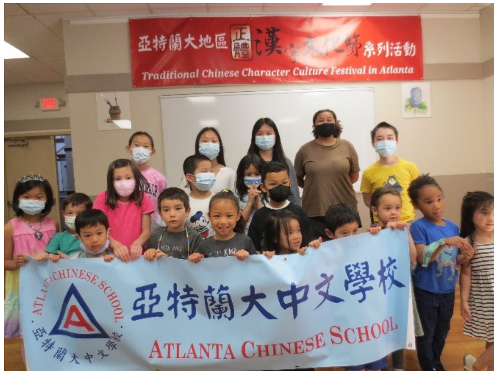
僑校部分參賽學生於比賽後合影

亞特蘭大中文學校希望能藉由漢字詩詞朗誦比賽，讓學生經由聽說讀寫的過程加深對中文的認識，提升學習興趣，推廣中華文化之美。