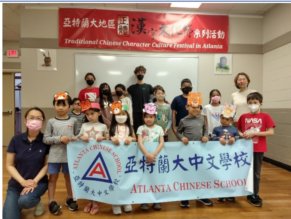
幼幼班在比賽前合照