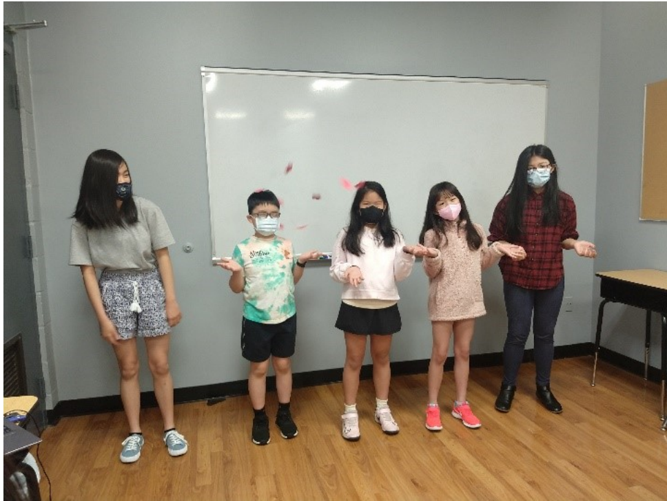
中年級班創意詩詞朗誦