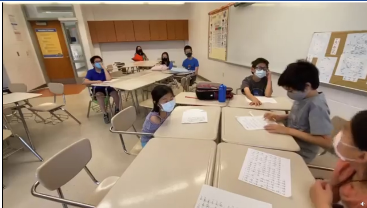
華文介紹七大洲和五大洋