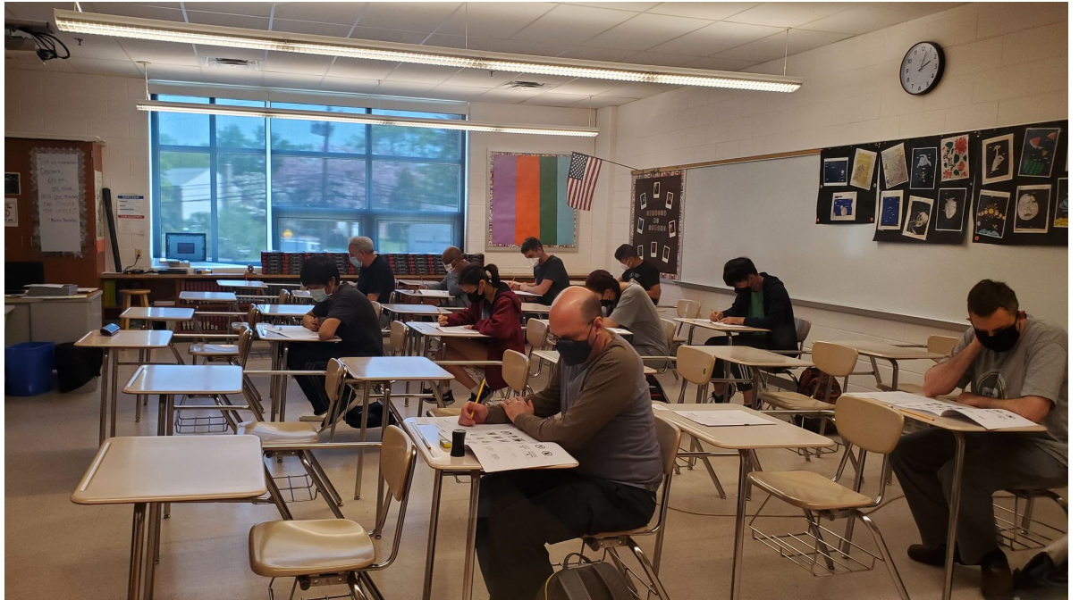
臺灣學校華語文中心學員進行華測