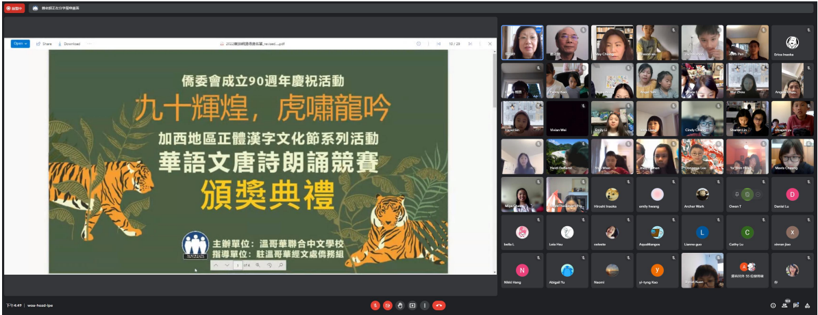
「90輝煌，龍吟虎嘯-漢字文化節唐詩朗誦競賽」線上頒獎，百餘名師生及家長出席觀禮