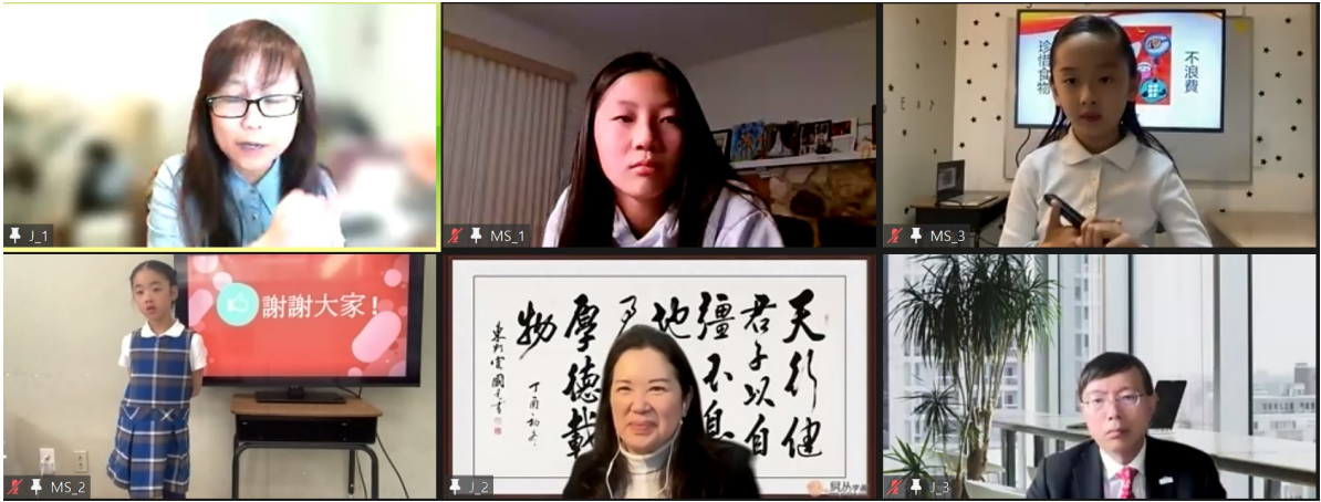
北加州中文學校2022年【多媒體簡報比賽】3