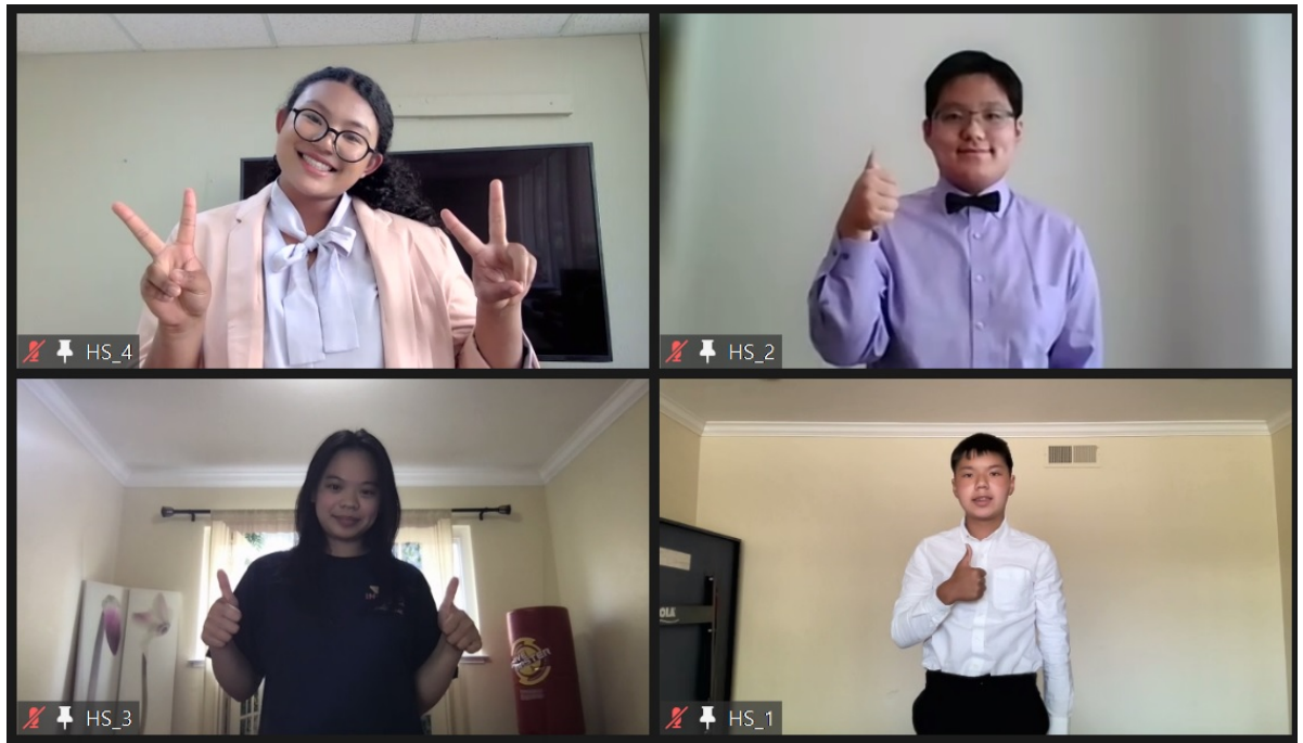
北加州中文學校2022年【多媒體簡報比賽】4