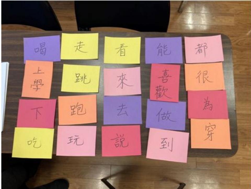
運用自製自卡做識讀題目