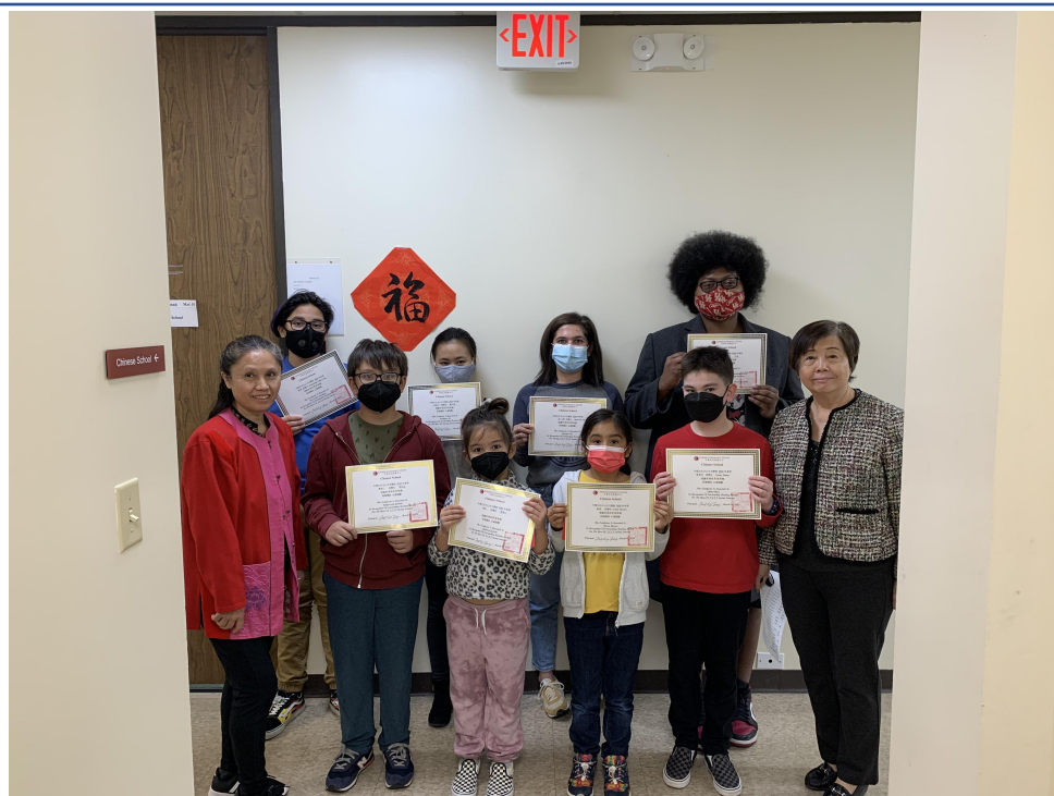
得獎學生和老師合影