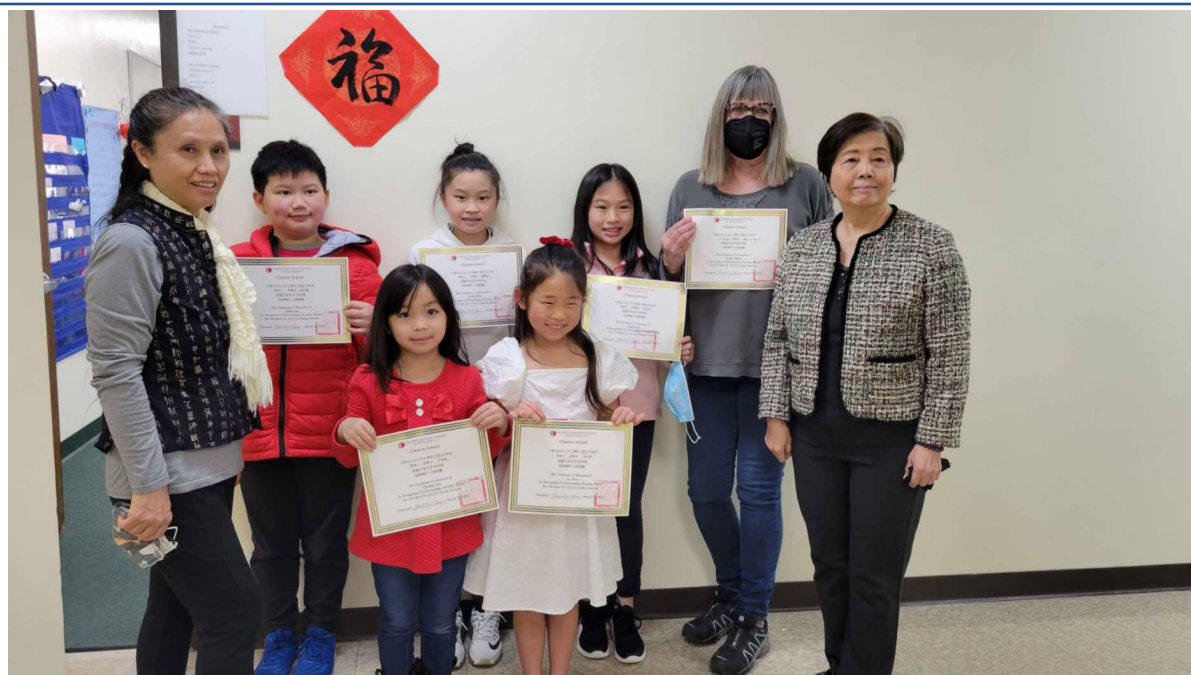
得獎學生和老師合影