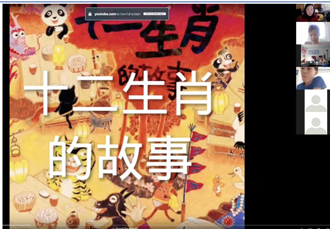
中德語說故事時間：十二生肖的故事