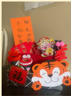
第一名 幼大誠班 鄭允和