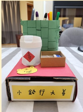
第一名 四年誠班 李正之