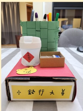
第一名 四年誠班 李正之