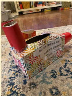
第一名 幼小誠班 黃莘昕