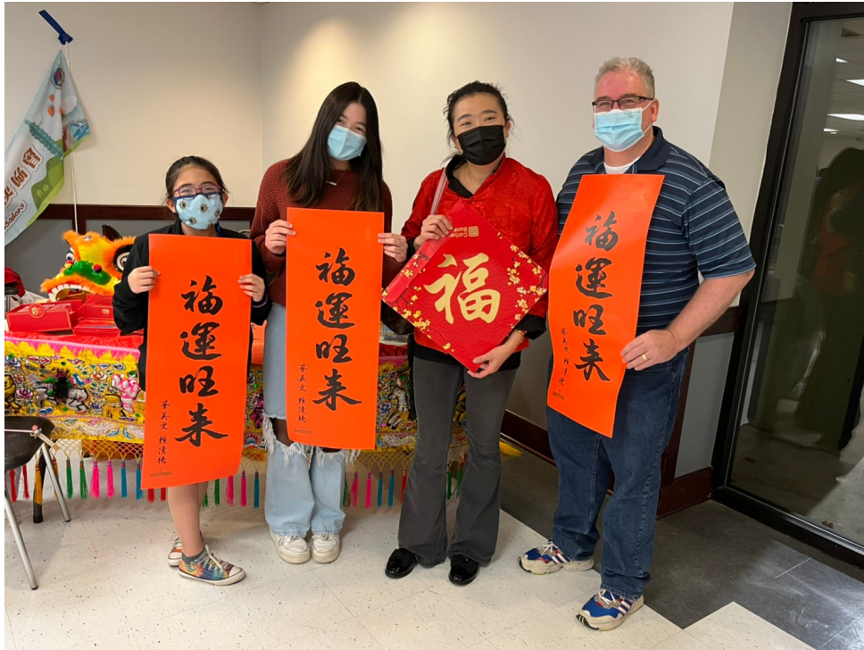
北維州實驗中文學校校長全家福