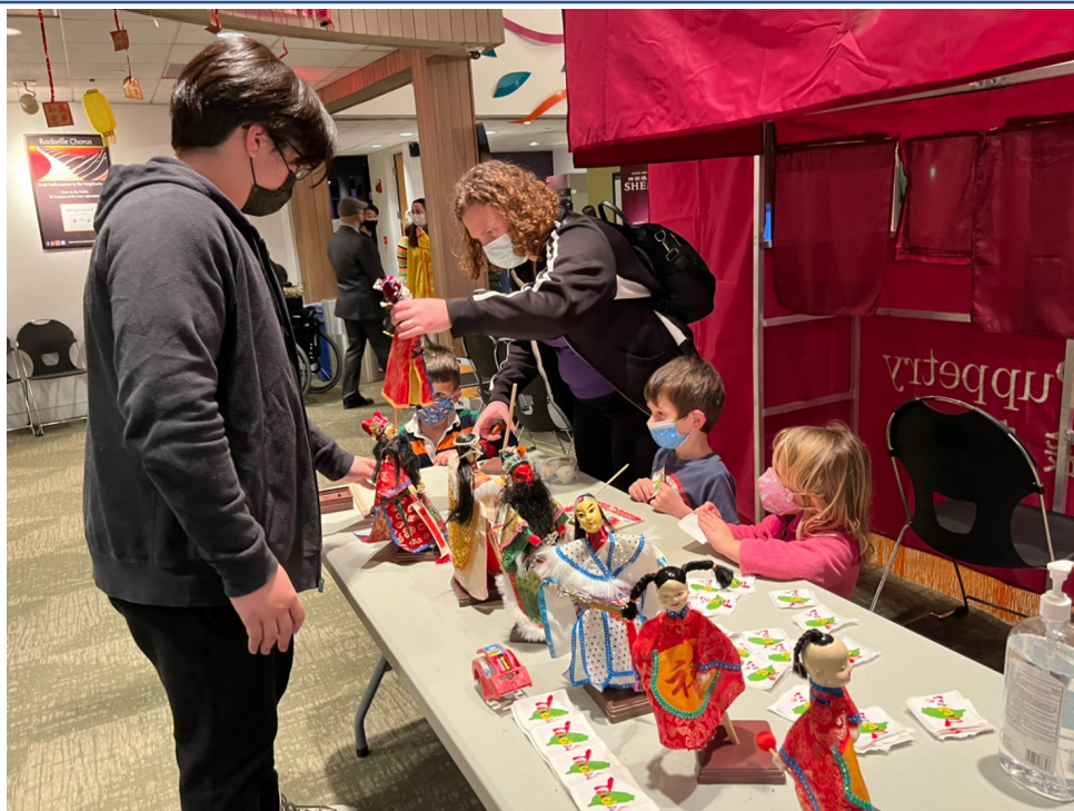
在地民眾體驗臺灣布袋戲