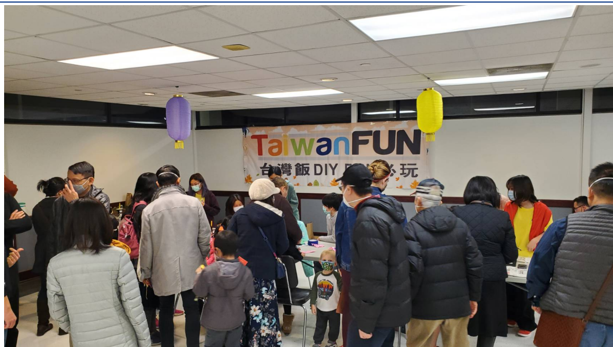
在地民眾體驗文化攤位