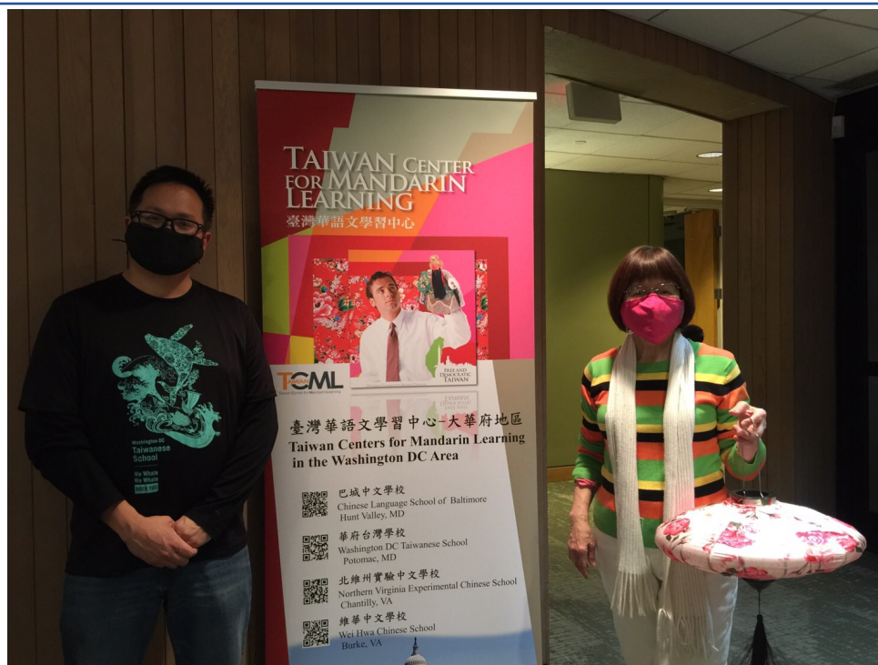
臺灣學校校長, 老師和華語文中心 banner 合照留念