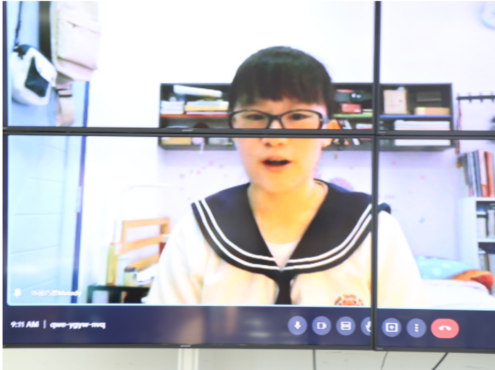
部分參賽者在線上參加比賽（高中組）