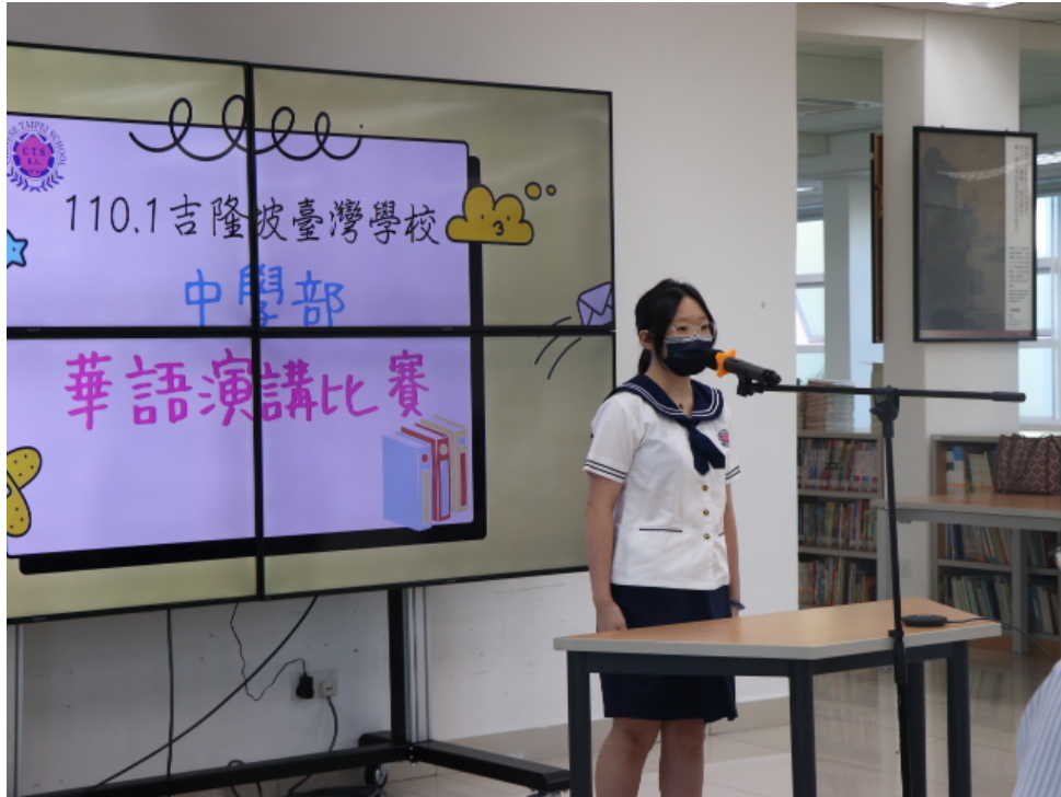
現場參賽的參賽者（國中組）