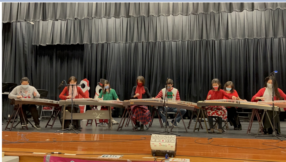
古箏團隊的琴聲相伴