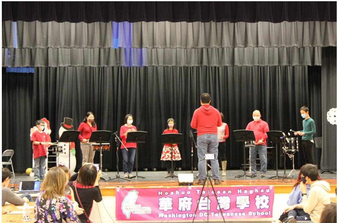
「臺灣學校打擊樂團」表演