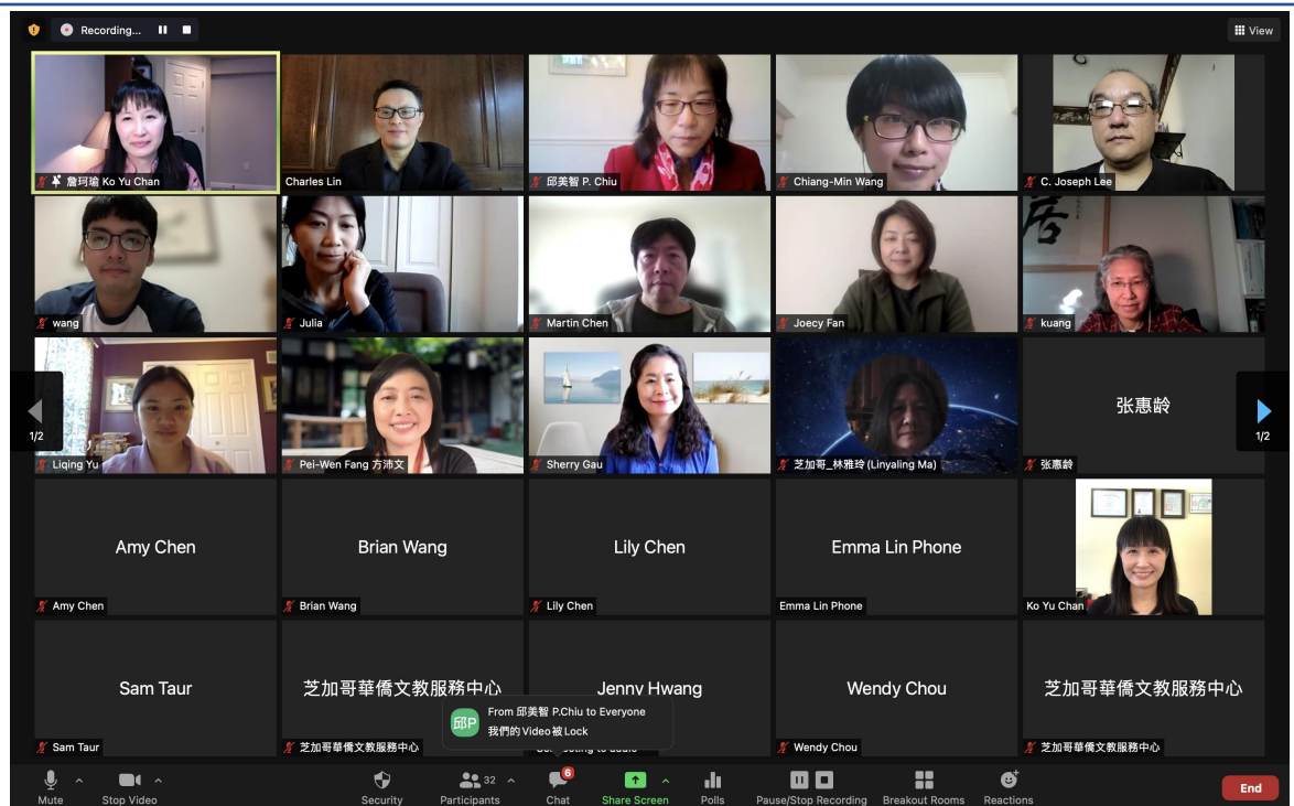
密西根中文學校聯合會2021年秋季線上華語文研討會1