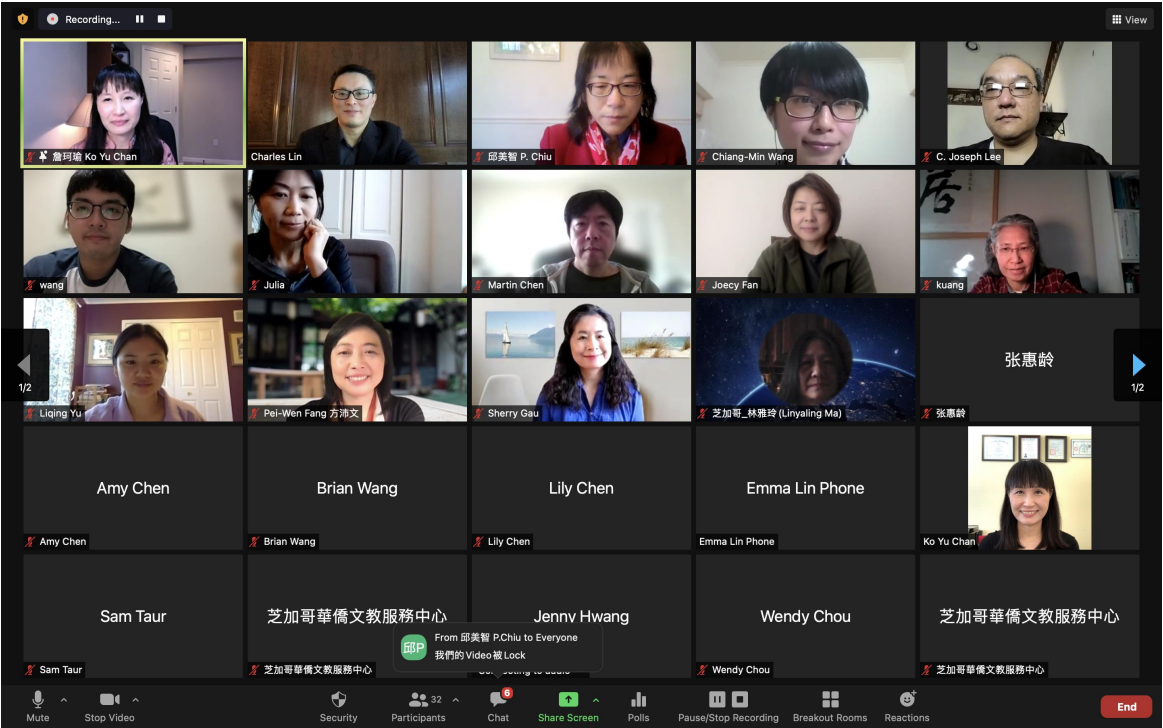
密西根中文學校聯合會2021年秋季線上華語文研討會1