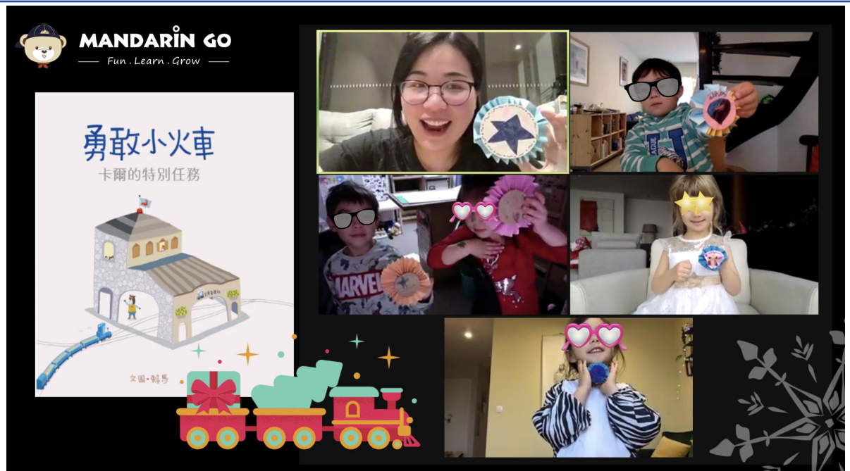
《勇敢小火車》繪本故事 - 勇敢勳章