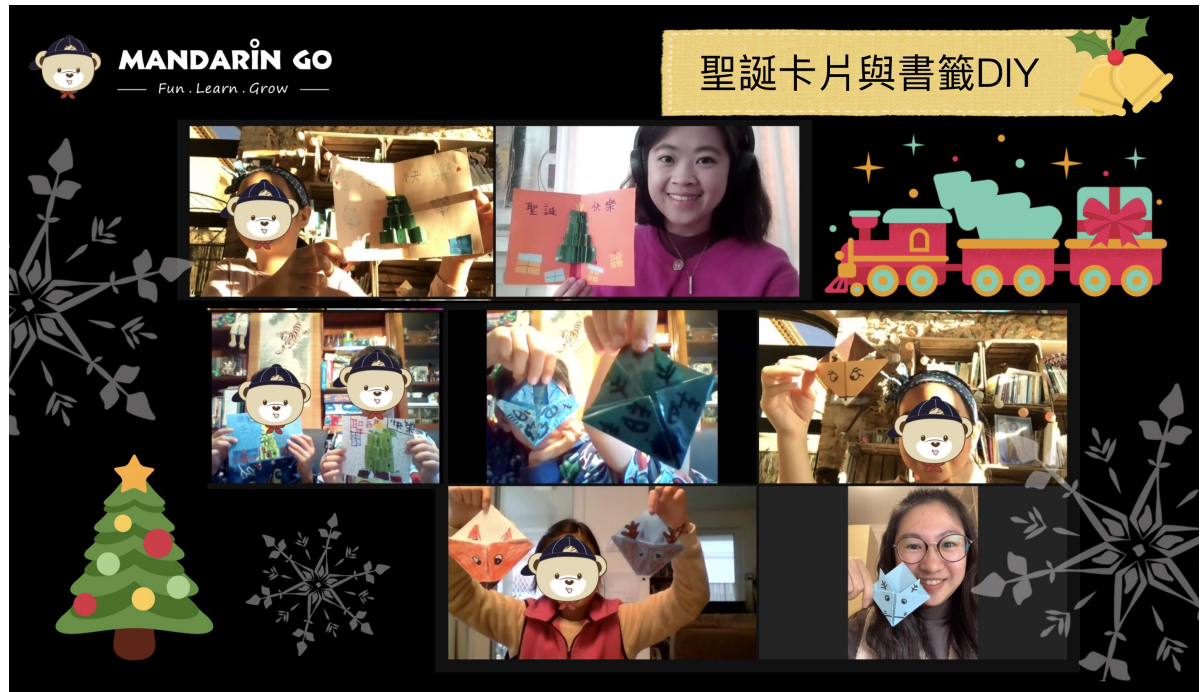
立體聖誕卡片製作與麋鹿書籤製作