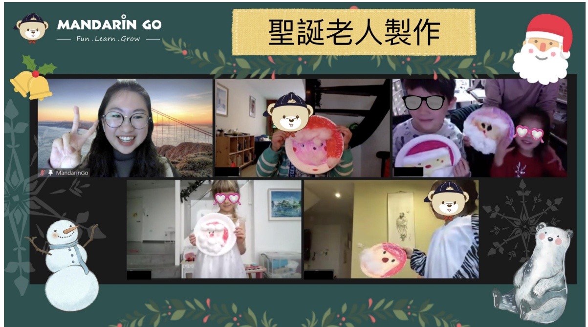
聖誕節的由來與活動 - 聖誕老人