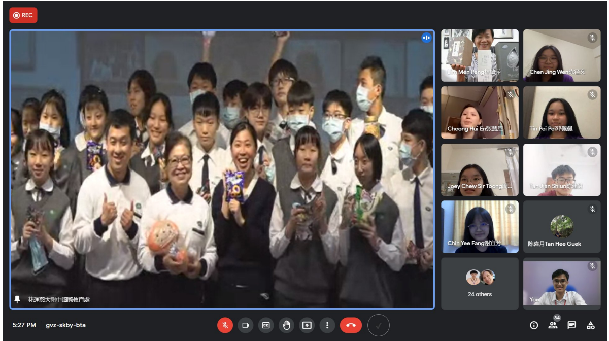
來張大合照~ (2021. 11. 16)