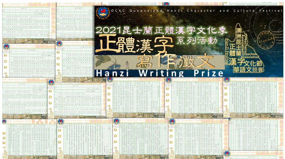
昆士蘭華語文教師聯誼會正體漢字寫作徵文活動1

110年度昆士蘭正體漢字文化季系列活動因疫情改變形式進行並延後辦理，活動仍致力於僑居地推廣正體漢字書寫和生活美學，藉由文字與文化活動之推廣宣傳，鼓勵當地學子與社會人士體驗正體漢字之美，廣泛提升華語文學習興趣，傳承及弘揚優良中華文化。本年度因疫情沒能舉辦的朗讀與硬筆字書寫比賽，詢問度仍然相當踴躍。主辦單位感謝大家對於正體漢字文化季持續的愛護與支持！