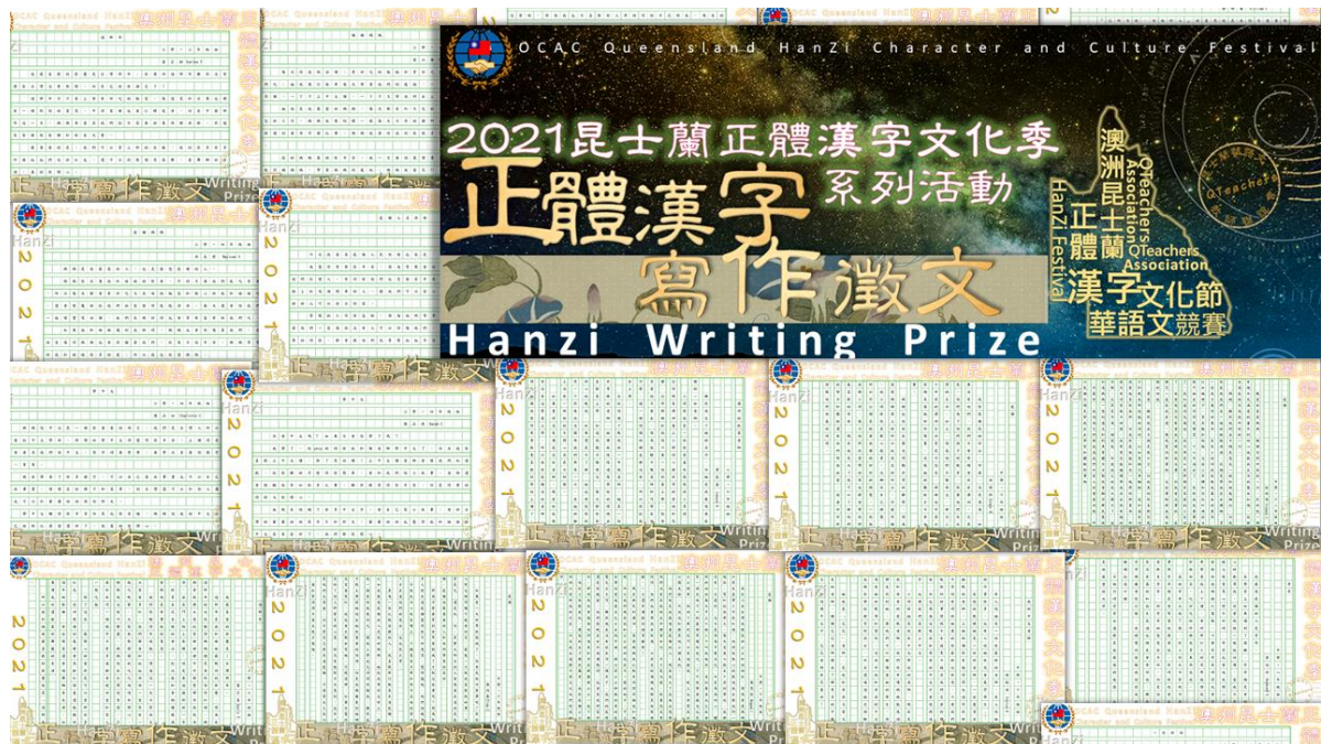
昆士蘭華語文教師聯誼會正體漢字寫作徵文活動1

110年度昆士蘭正體漢字文化季系列活動因疫情改變形式進行並延後辦理，活動仍致力於僑居地推廣正體漢字書寫和生活美學，藉由文字與文化活動之推廣宣傳，鼓勵當地學子與社會人士體驗正體漢字之美，廣泛提升華語文學習興趣，傳承及弘揚優良中華文化。本年度因疫情沒能舉辦的朗讀與硬筆字書寫比賽詢問度仍然相當踴躍。主辦單位感謝大家對於正體漢字文化季持續的愛護與支持！