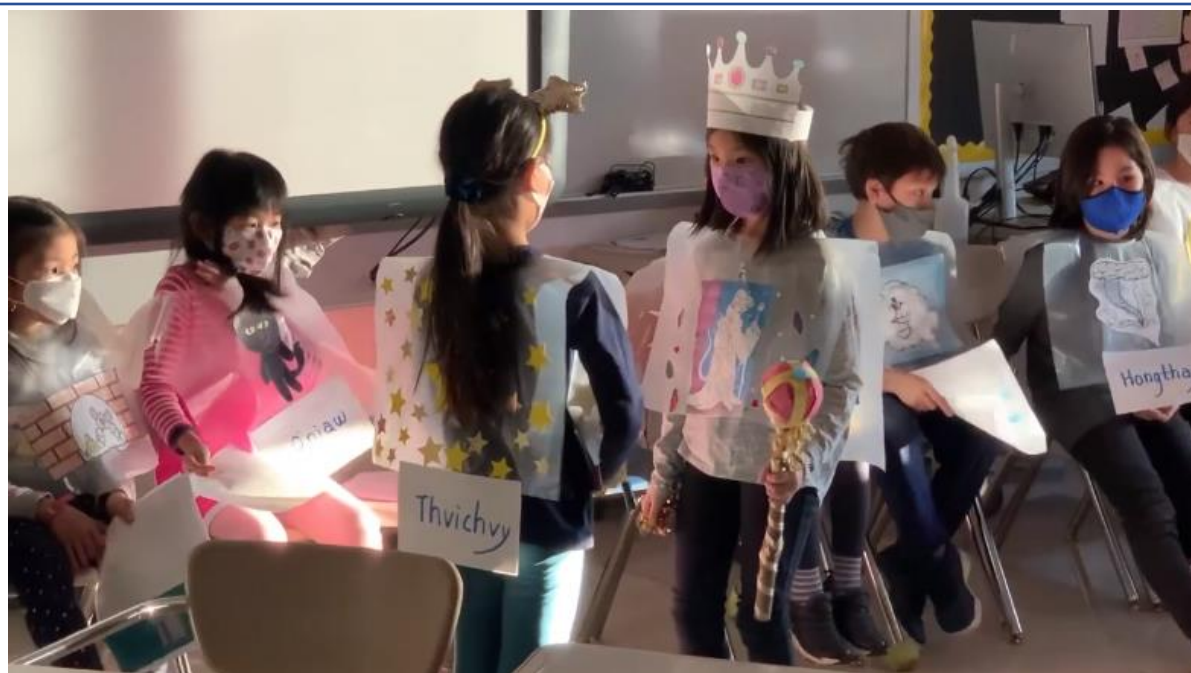
演出「鳥鼠國找最厲害的鼠做新國王」