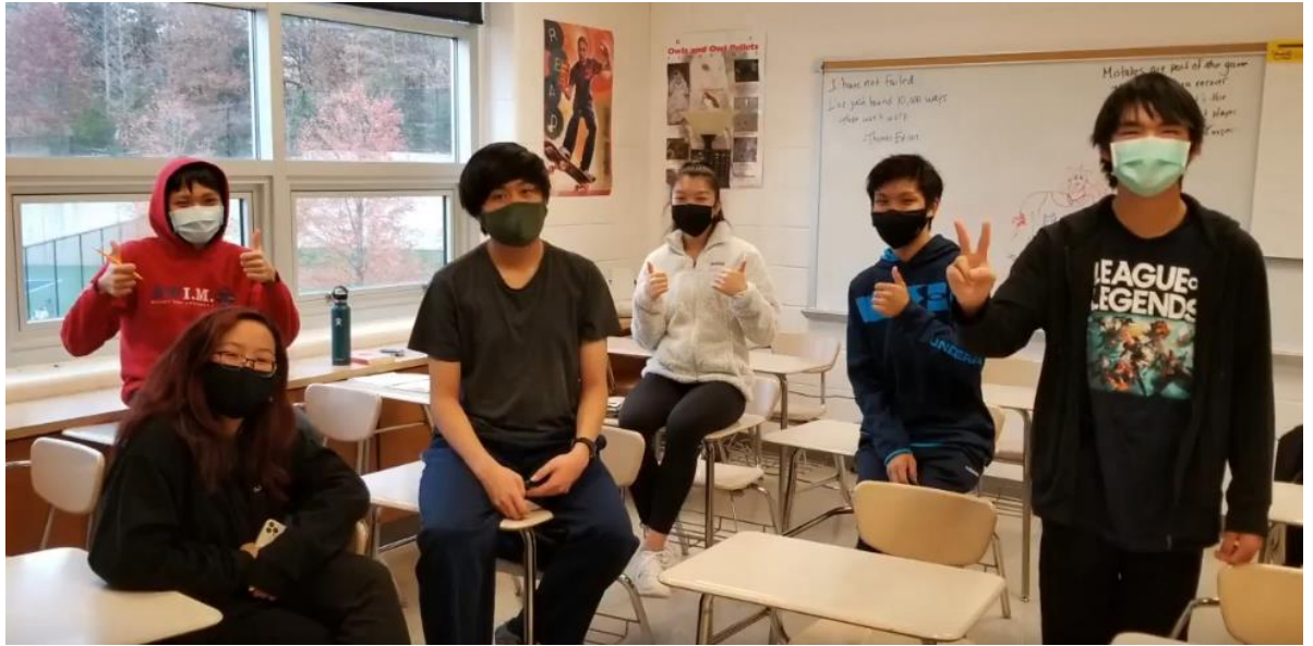
高中臺語班群體創作影片