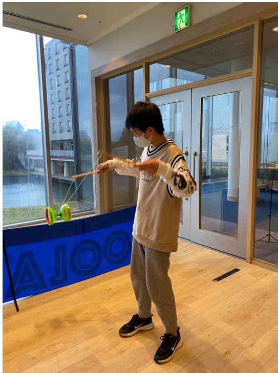
充滿興趣地挑戰著僑委會所提供的扯鈴。

整天的活動不僅再度提高了小朋友們的華語能力，樂趣十足的遊戲也提高了學習動力，全員皆滿載而歸！