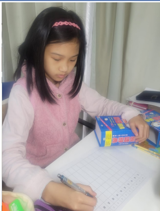
110學年度愛育學校 正體漢字文化節「全校查字典比賽」2