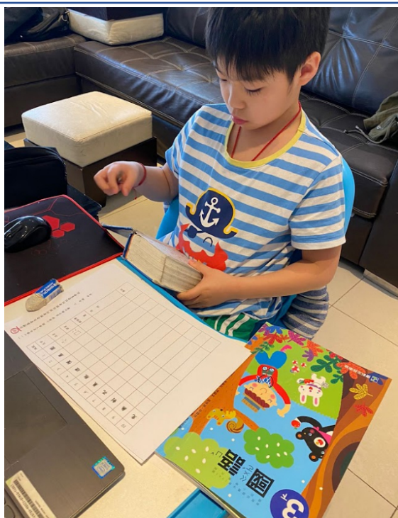
110學年度愛育學校 正體漢字文化節「全校查字典比賽」3