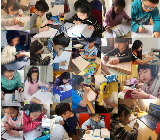
110學年度愛育學校 正體漢字文化節「全校查字典比賽」5