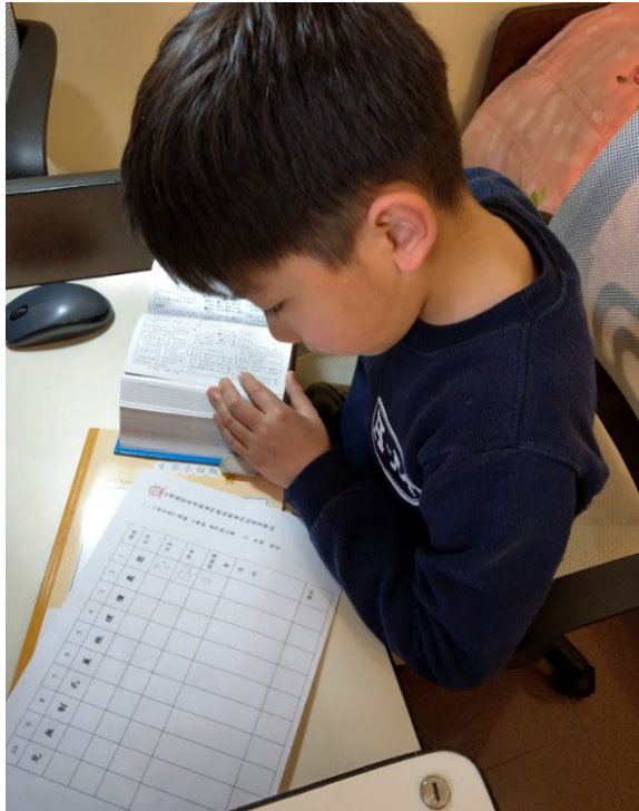
110學年度愛育學校 正體漢字文化節「全校查字典比賽」6