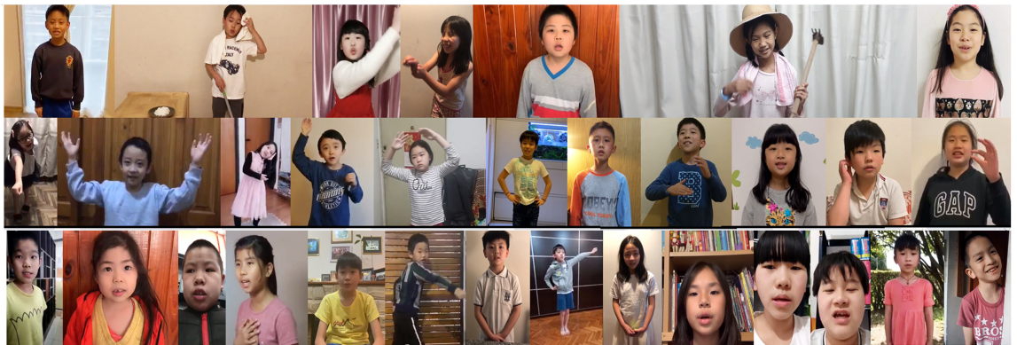
110學年度愛育學校 正體漢字文化節「唐詩唱遊比賽」1