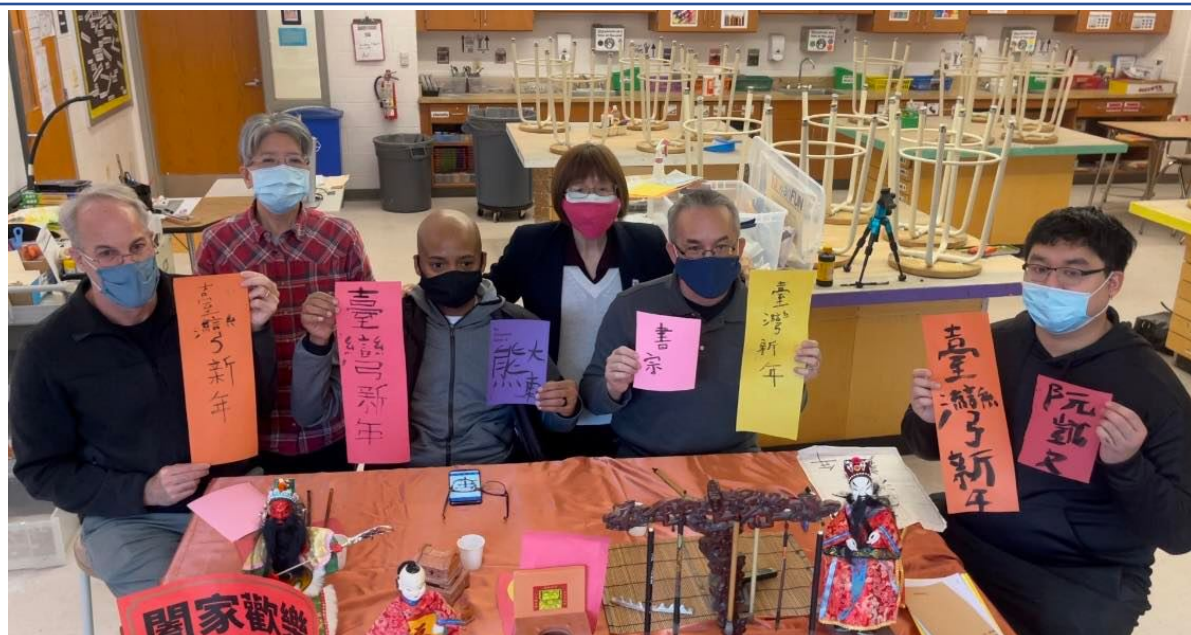
學員們和老師們的合照