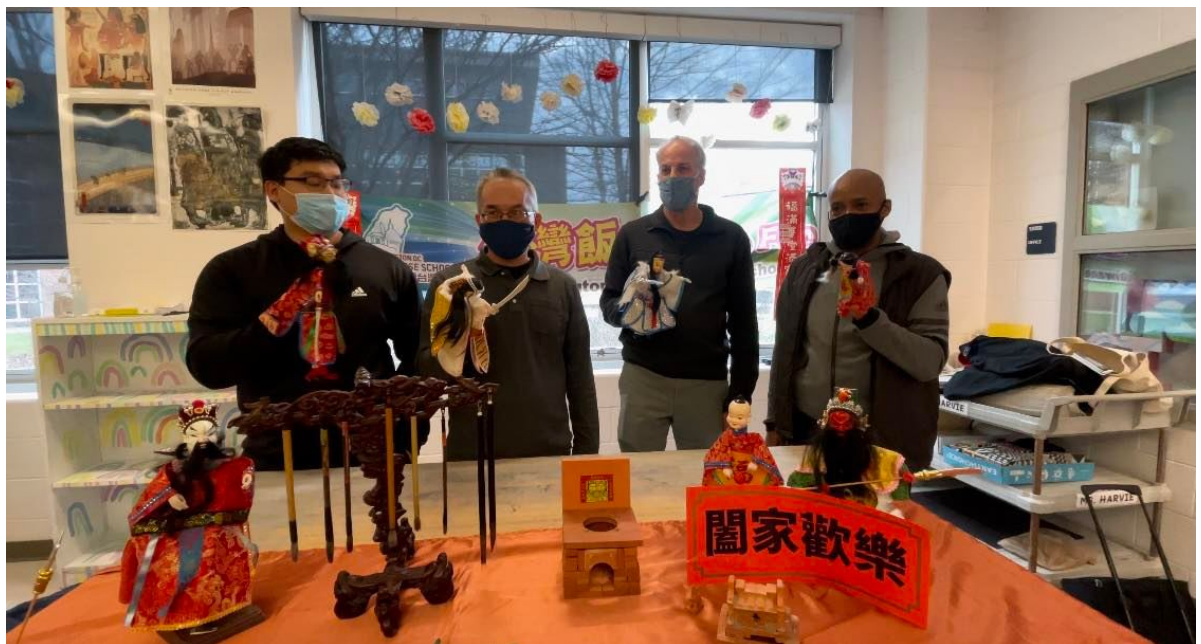
學員們更拿起布袋戲逗陣比劃

臺灣學校用心辦學, 學語文中心提供一個良好之學習環境, 不論在教材和師資都經過嚴密的規劃和訓練, 大多數的任教老師皆在僑界有15-20年的華語教學。臺灣學校WDCTS華語中心的學員每一位都相當認真學習, 並在此次活動中看到豐頭的學習成果。