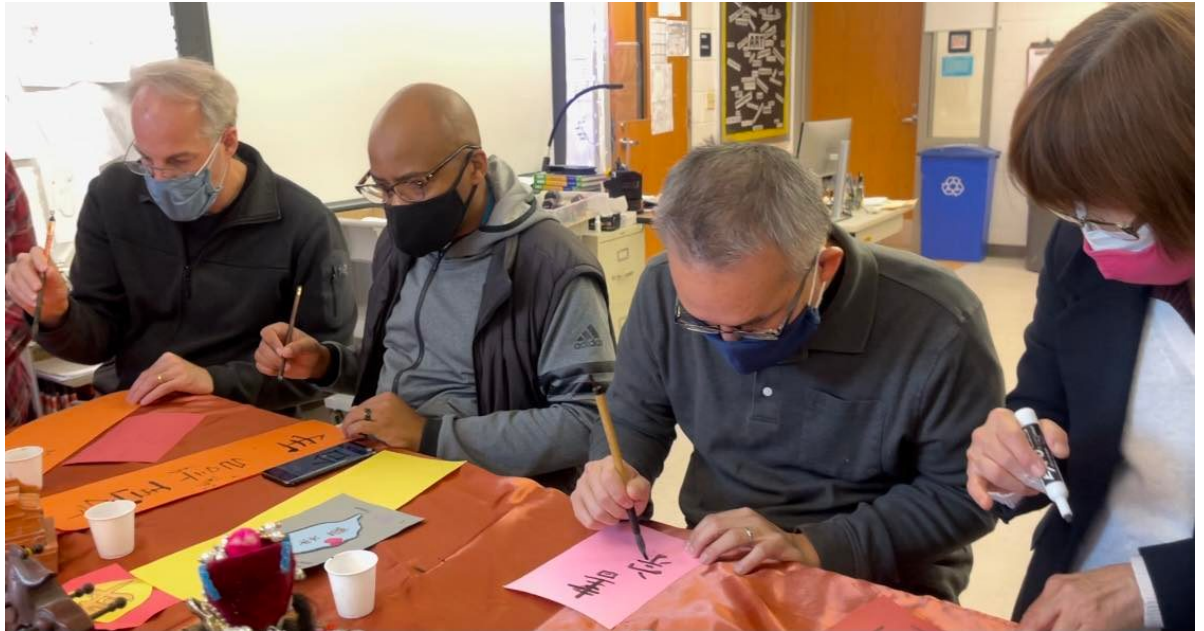
學員們臨摹書法並練習書寫春聯和正體字名字