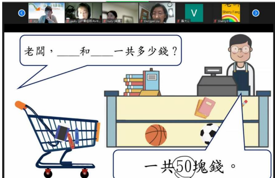
華語向前走第一冊範例