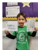
WhatsApp Image 2021-11-13 at 9.00.51 P