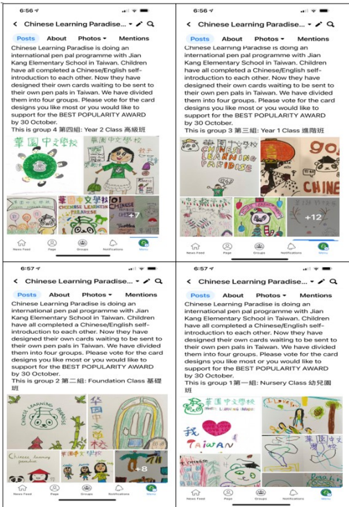
華園中文學校致贈國際學伴卡片設計比賽1

華園於今年九月開始正式與臺北的健康國小進行國際學伴的交流互動，藉此鼓勵華園學生自己設計具有華園特色的卡片，如華園校徽、校服等，從構圖、標題、文字訊息的撰寫都自己動手來，與學伴進行交流也同時讓學伴更了解華園特色。 另於10月20-30日期中假期間，進行臉書投票及10月31日進行教師投票。 卡片設計比賽完成後，孩子們於中文課堂一起寫卡片內容在自己設計的卡片裡，課堂老師協助中文句子及單字指導，之後由華園統一收集學生們的卡片，一起寄到臺灣給健康國小的學伴。