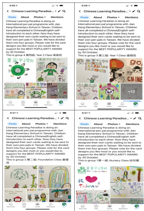
華園中文學校致贈國際學伴卡片設計比賽1

卡片設計比賽完成後，孩子們於中文課堂一起寫卡片內容在自己設計的卡片裡，課堂老師協助中文句子及單字指導，之後由華園統一收集學生們的卡片，一起寄到臺灣給健康國小的學伴。