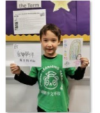
WhatsApp Image 2021-11-13 at 9.00.51 P