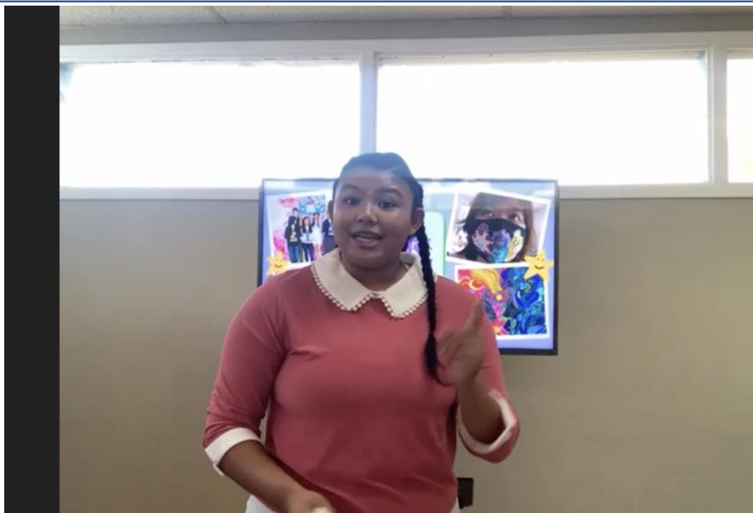
國語演講比賽高年級組第一名