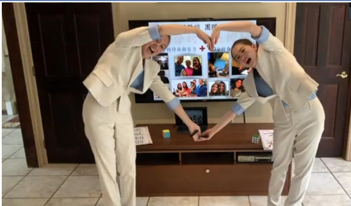
多媒體雙人組第一名