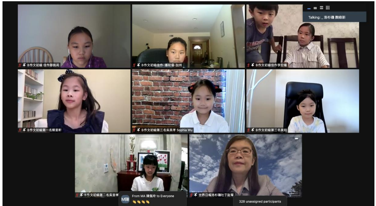
世界日報于趾琴社長與初級組得獎學生合影