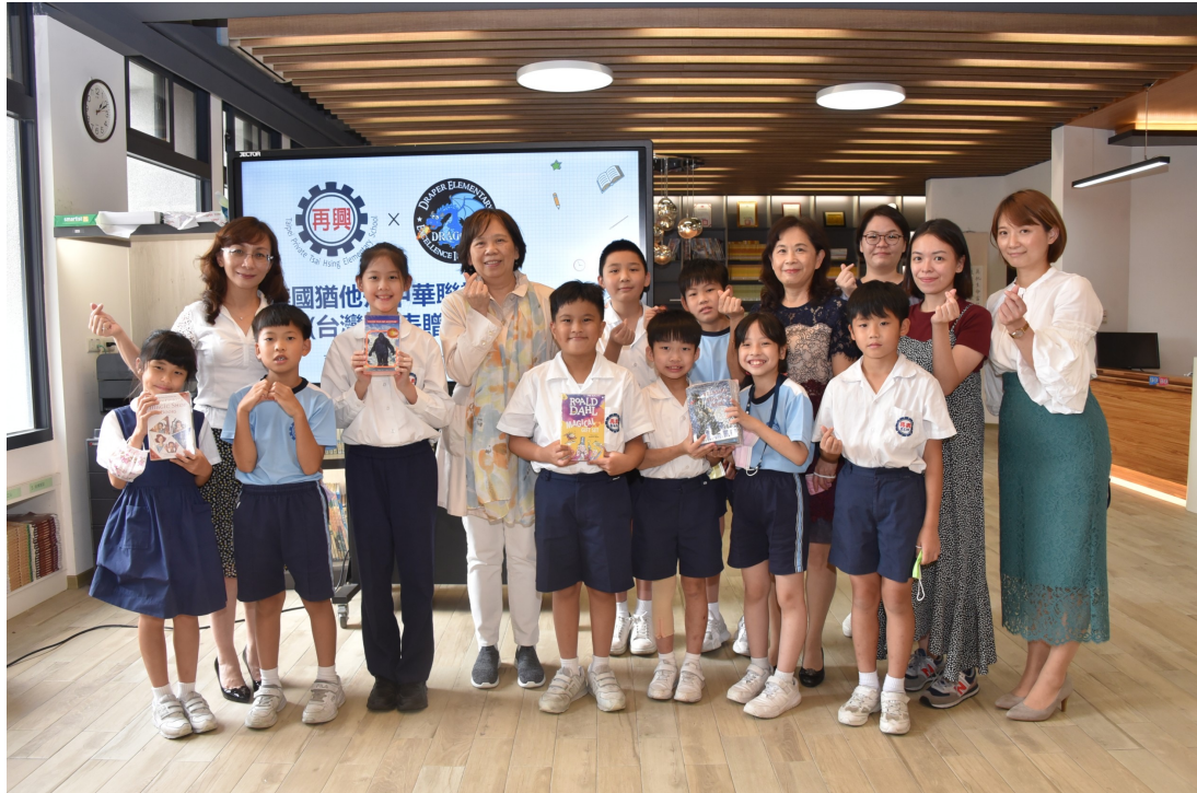
北市再興小學師生感謝猶他州中華聯誼會贈送優良叢書