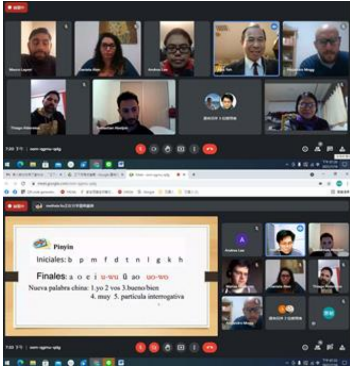
僑務葉秘書於開課前介紹臺灣及鼓勵學員