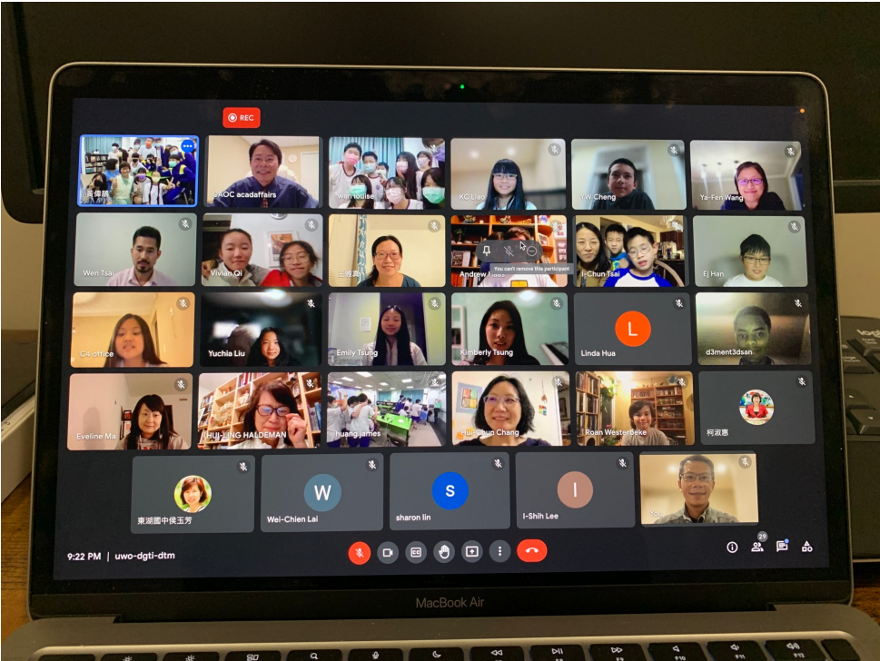
克里夫蘭中文書院家長與師生