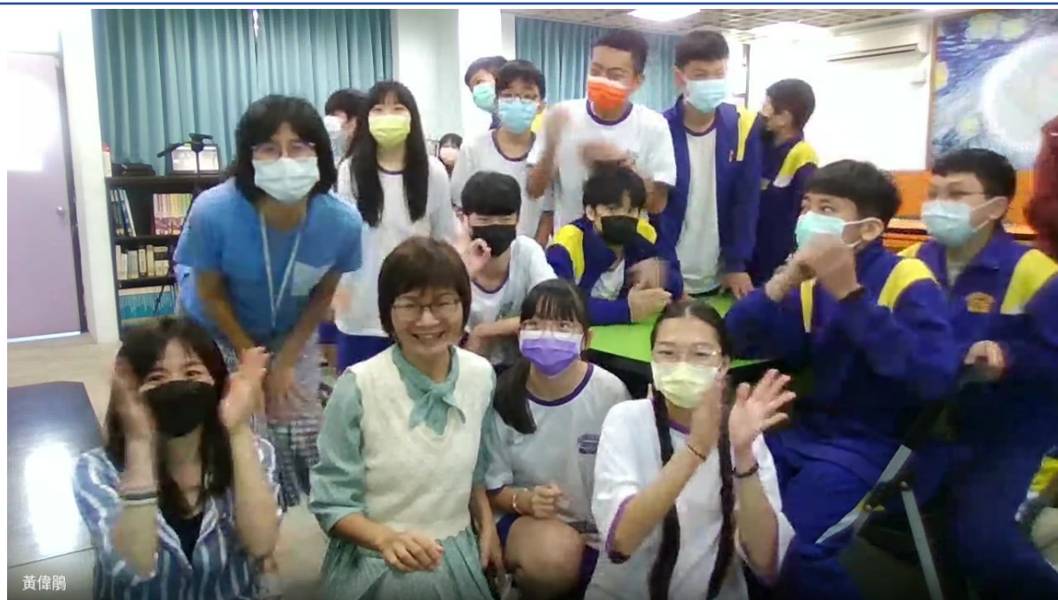
東湖國中校長與八年八班全體師生