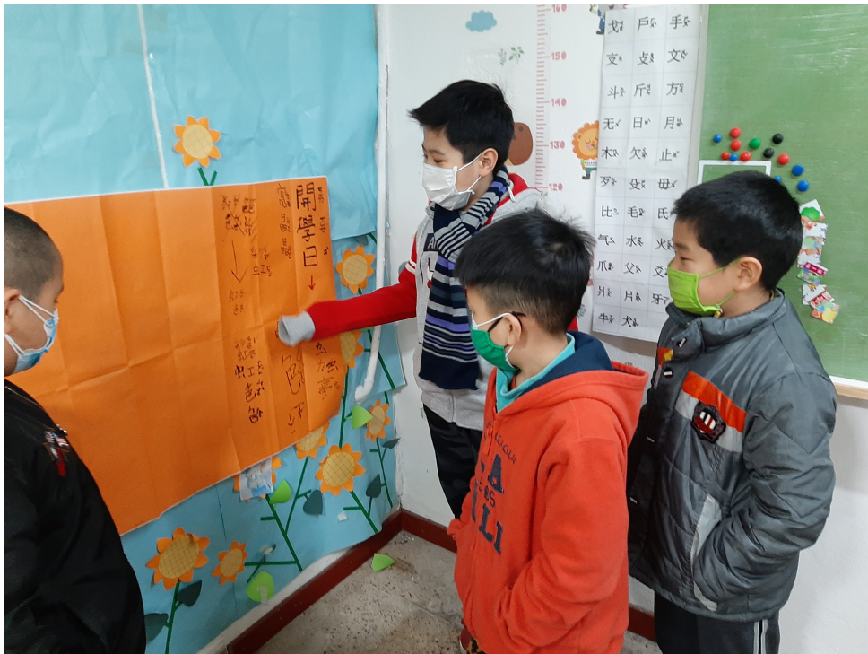
低年級學生在測試前的詞語接龍練習

平時中低年級的學生在造詞上不會有太大的困難，一旦遇上造句就會讓有些程度較差的孩子直接放棄不寫，因此經常性的擴句練習就格外重要了。另外阿根廷學生們也表示在學中文的過程中，老師要求「背書」將課文中的美言佳句背下來是他們在仿句及創作上一個很好的助力，同時也開啟未來寫作的一個好的基礎。