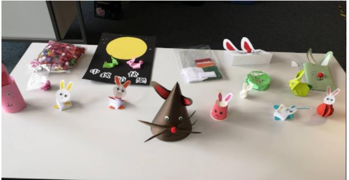
與慈濟師姐手作可愛的紙兔子