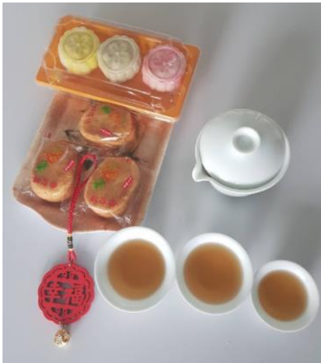
與老師舉行中秋節茶會

適逢中秋佳節，倫敦慈濟人文學校各班舉行了慶祝活動。正五和正六班的同學閱讀嫦娥奔月的故事片段，之後兩人一組進行”把故事排成正確的順序”比賽，最快為優勝組。 正三和正四的同學也發揮巧思，與慈濟師姐手作可愛的紙兔子。 正一和正三的小朋友一起認識中秋節的習俗故事，也學習了有關中秋節的詞彙。 成人班學生藉此學習中秋團圓的習俗，與老師舉行中秋節茶會，一起品嚐傳統的中秋美食併高唱”月姑娘”。 學生們從這些活動中，學習到中秋的文化意涵，也感受到過中秋節的歡樂氣氛。學生投入活動的熱情及伴隨的笑聲，應該是本次各班活動成功的最佳指標。