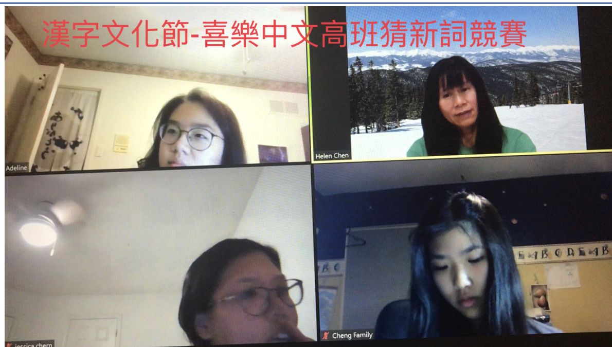
2021-Q3 高班. jpeg