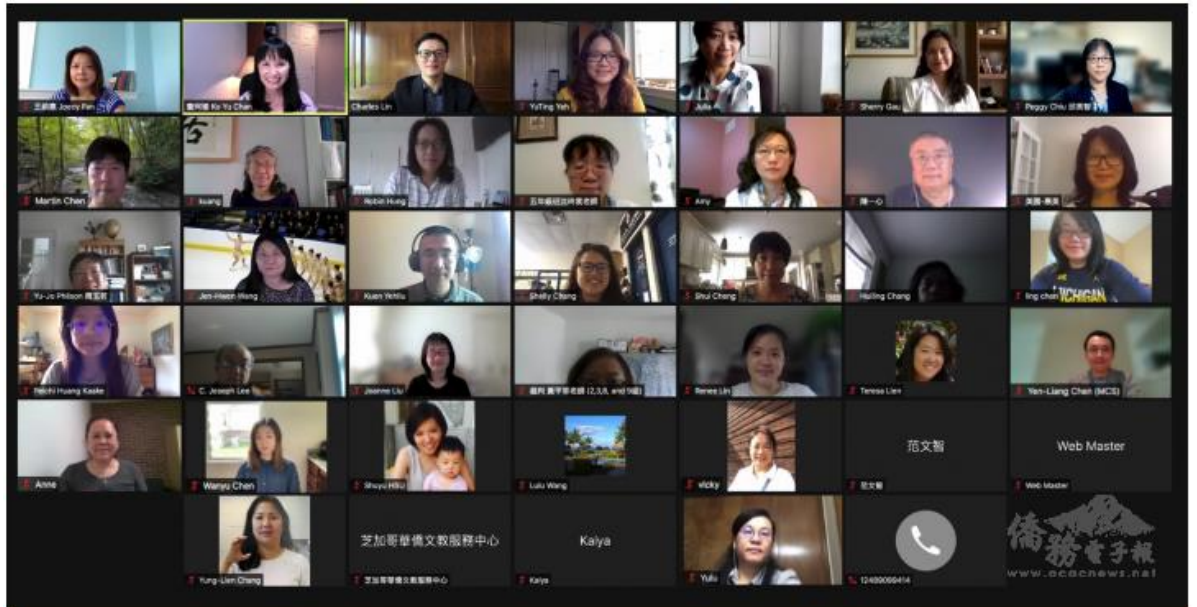
2021年密西根中文學校聯合會線上華語文教學研習會3