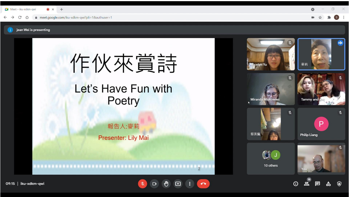
美國明尼蘇達州臺灣線上圖書館舉辦2021漢字節「想想一首我的詩」4