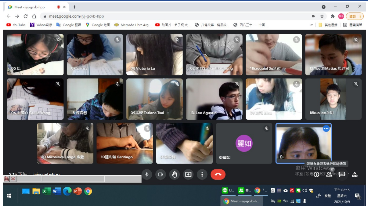
阿根廷華興中文學校中學部硬筆字活動3