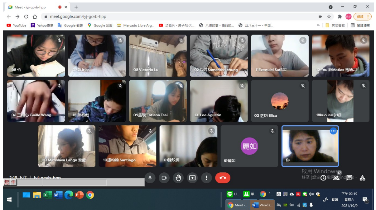
阿根廷華興中文學校中學部硬筆字活動6