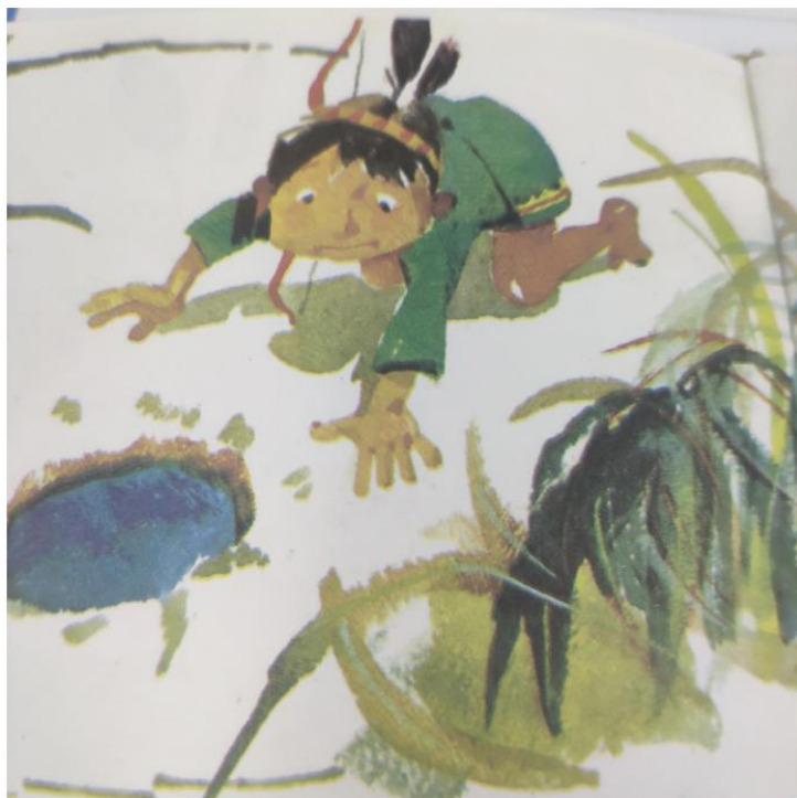
新興中文學校低年級看圖說故事比賽4