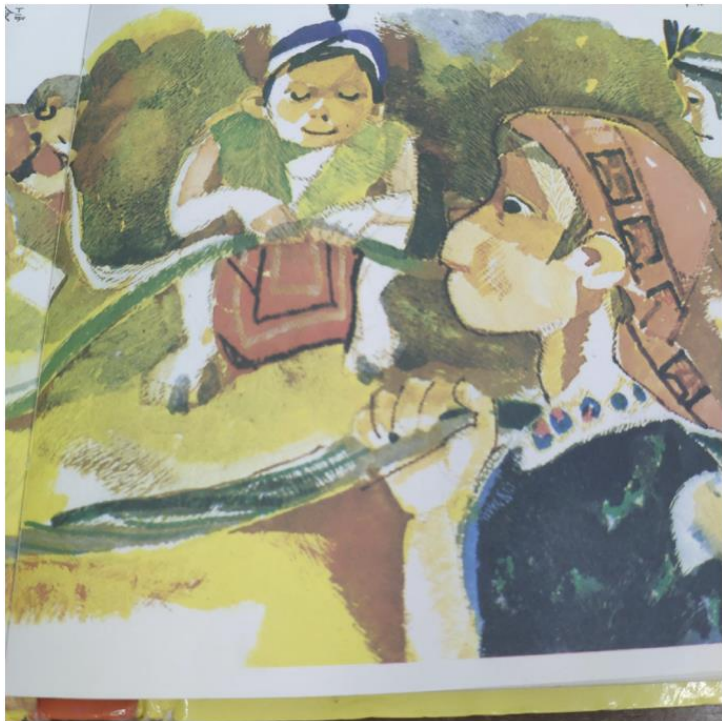
新興中文學校低年級看圖說故事比賽5