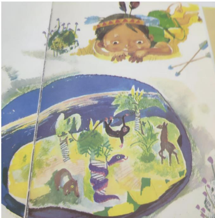
新興中文學校低年級看圖說故事比賽1