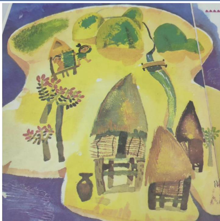
新興中文學校低年級看圖說故事比賽2