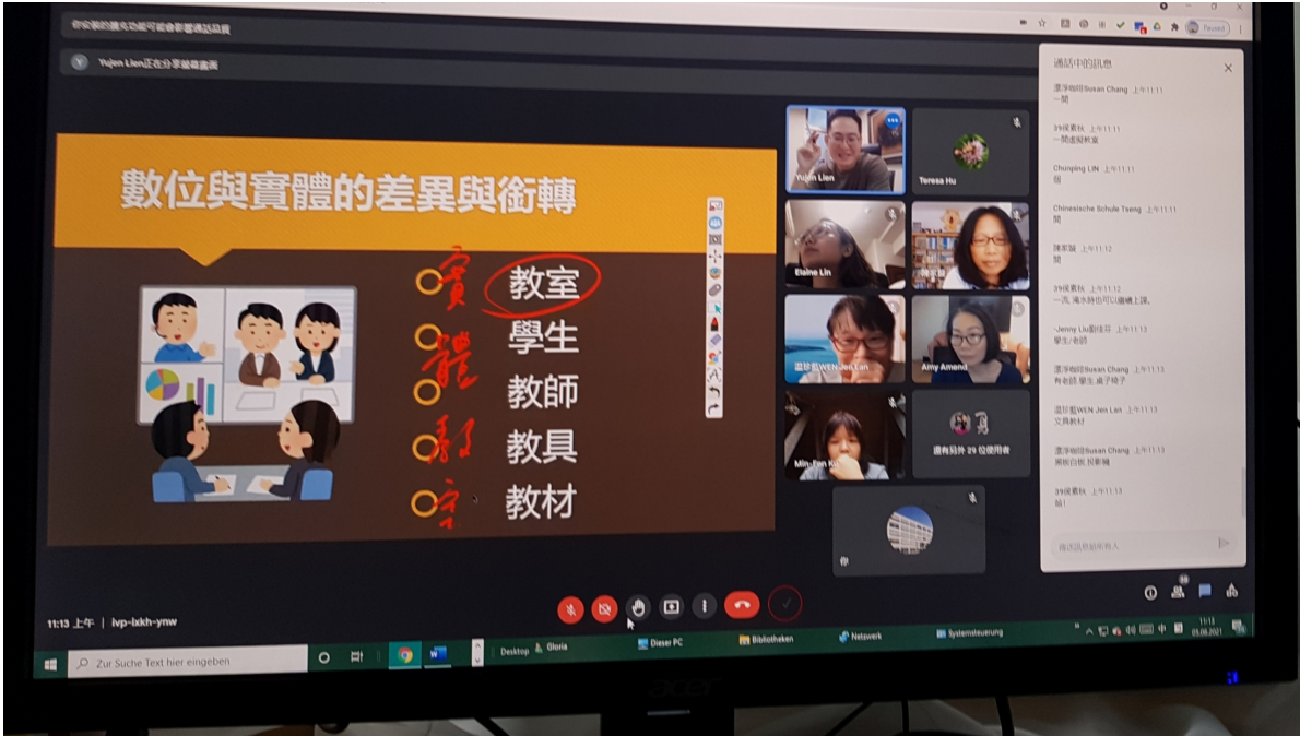
慕尼黑中文學校數位課程教育訓練與歐洲各僑校分享2