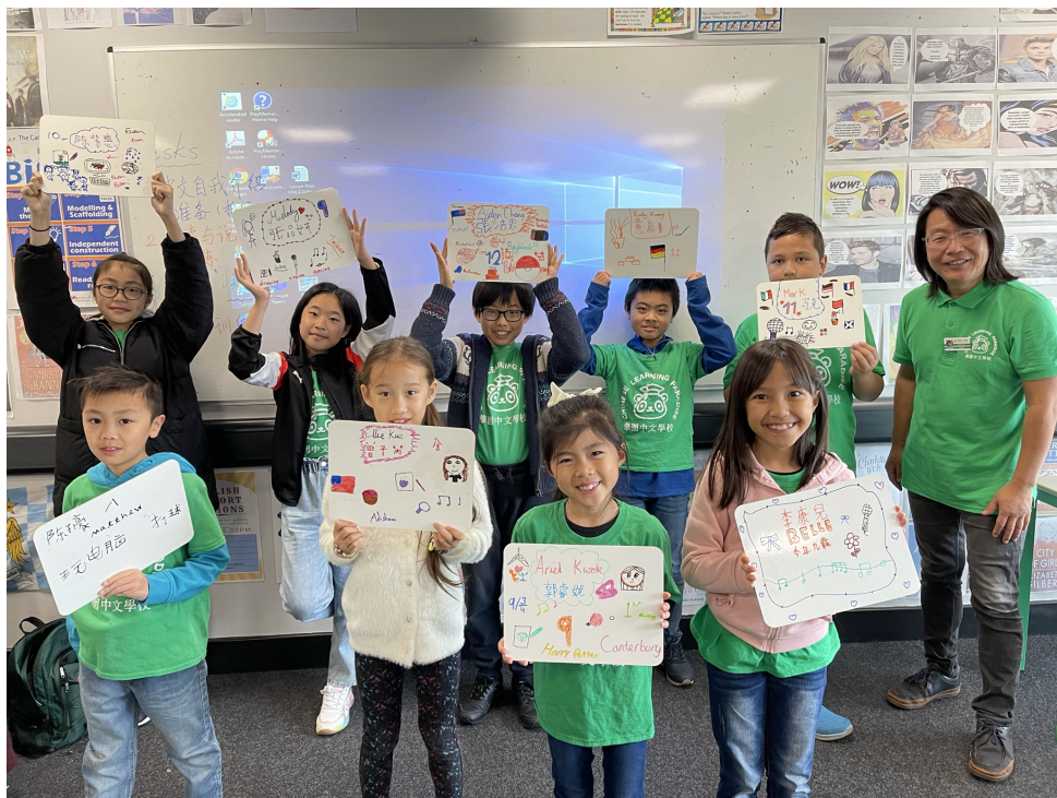
華園國際學伴交流計畫-破冰活動1

華園中文學校在僑委會國際學伴計畫的配對下，與臺北健康國小成為國際學伴，兩校雙方都對此計畫非常的積極和熱衷，自配對以來，便積極溝通、開會，已整合出整學年的國際學伴計畫活動。雙方於九月開學後，經過兩星期的準備時間，協助學生進行目標語的自我介紹練習和錄影，然後多次開會套論進行學伴配對和調整溝通，兩校也進行全體師生大合照及拍攝全體打招呼影片。華園於10月2日中文課結束後，全體師生集合，介紹國際學伴交流計畫，並認識健康國小的地理位置及學校特色，接續播放健康國小的破冰活動影片，讓學生有機會看到自己的學伴的中文自我介紹，隨後讓每個學生錄製他們給學伴的中英文介紹影片，為了讓國際學伴能更清楚或聽懂每個學生的中文自我介紹，當天中文課堂由授課教師協助每個學生將其自我介紹的內容事先或寫或畫摘要記錄在小白板上供錄影時使用，結束後並將錄影檔及照片上傳雲端寄給健康國小，讓他們於學校的晨光時間播放給學校師生看，完成第一階段的破冰和相見歡活動。