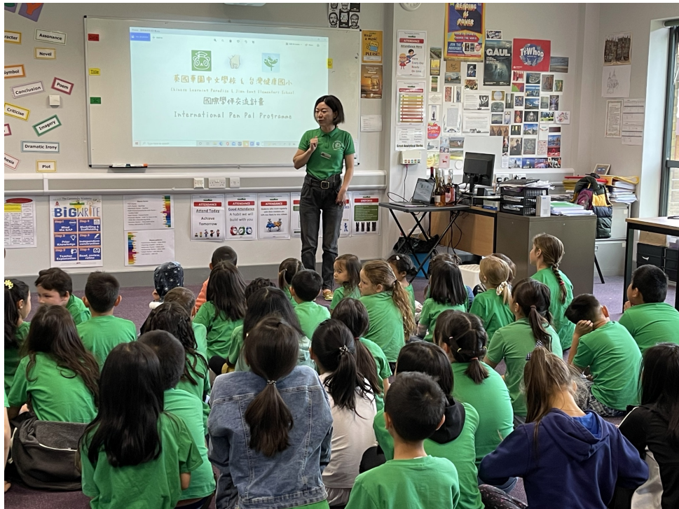
華園國際學伴交流計畫-破冰活動2