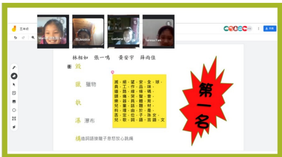
五年級詞語接龍冠軍組