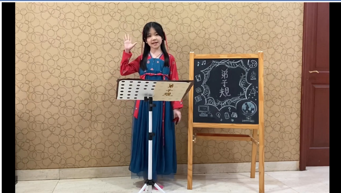
弟子規朗讀比賽高年級組 第三名同學以響板伴奏聲韻。