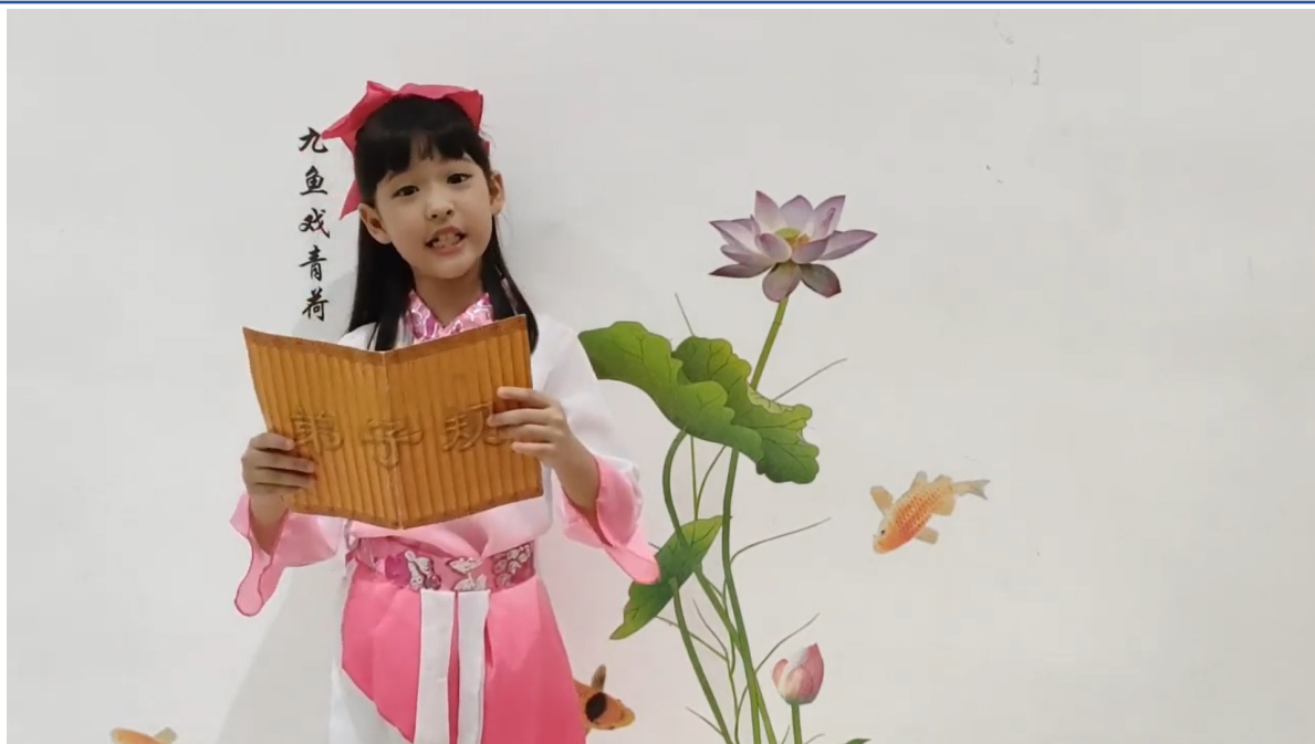
弟子規朗讀比賽低年級組第三名同學猶如書畫中走出來的古代學生