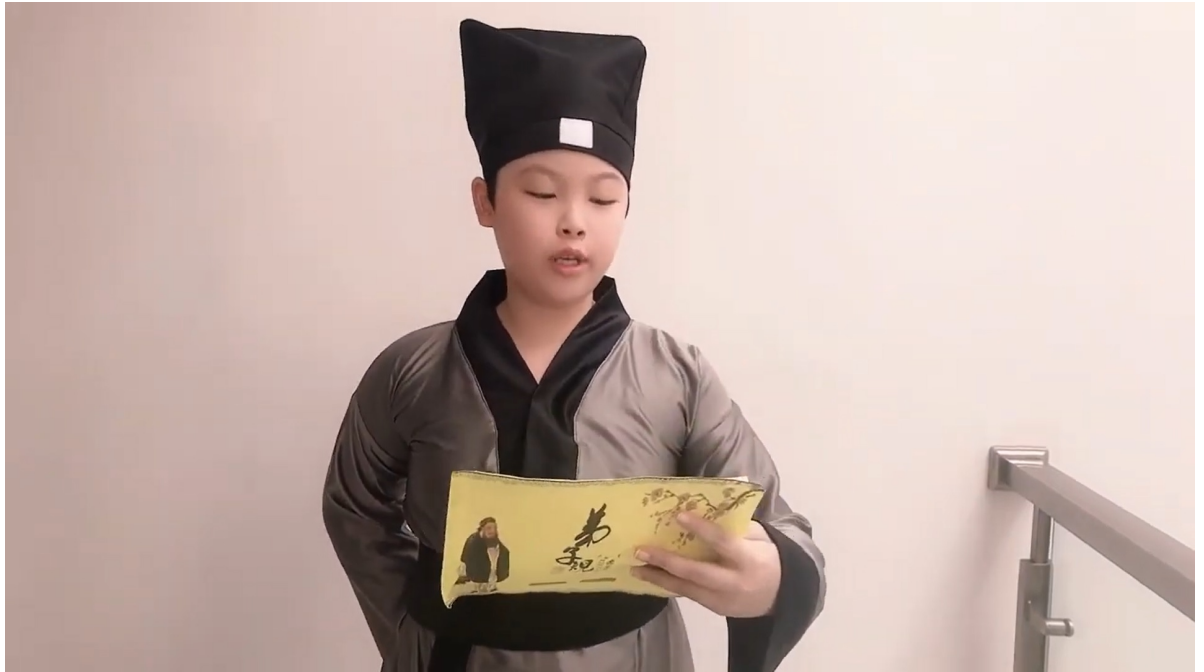
弟子規朗讀比賽高年級組第二名同學像是斯文的古代書生。