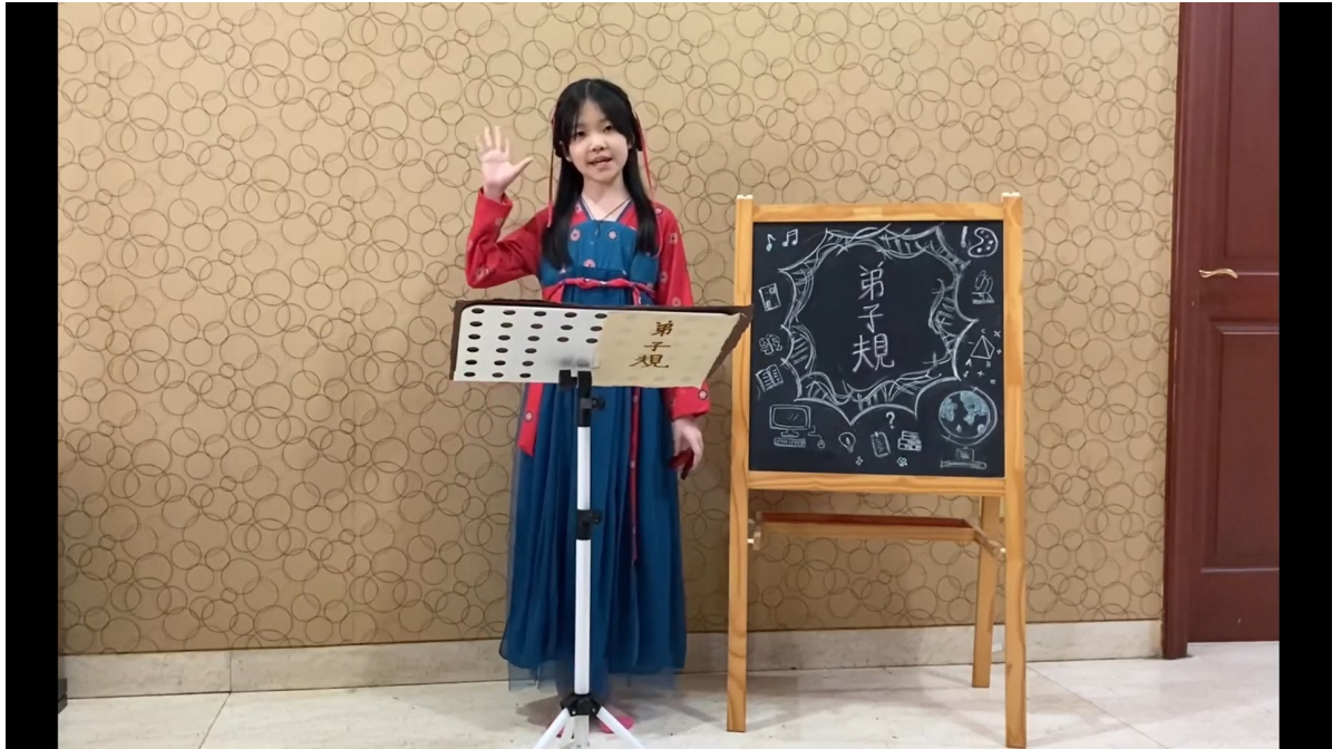
弟子規朗讀比賽高年級組 第三名同學以響板伴奏聲韻。