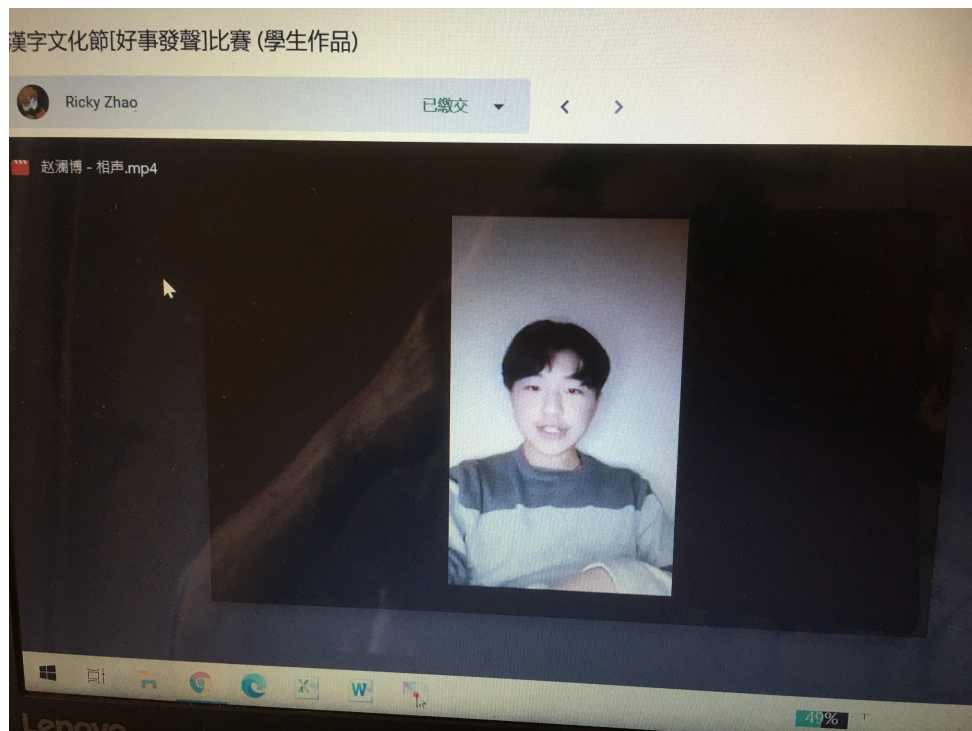
相聲比賽12到15歲組第一名