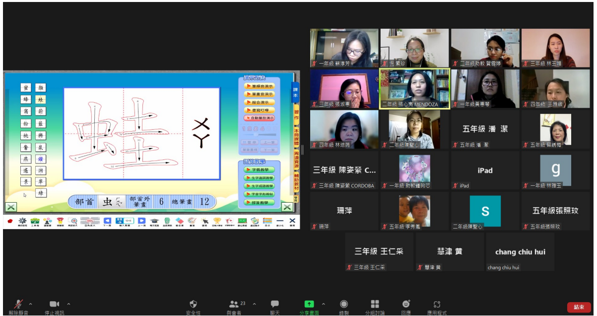
阿根廷華興中文學校110學年度 首都外省教師線上教學研習課程5