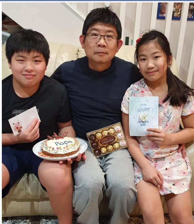
學童製作禮物致敬父親。