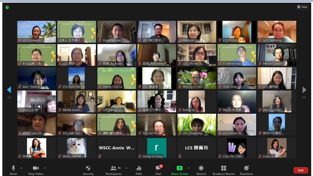
開幕典禮與會人士合照 2。