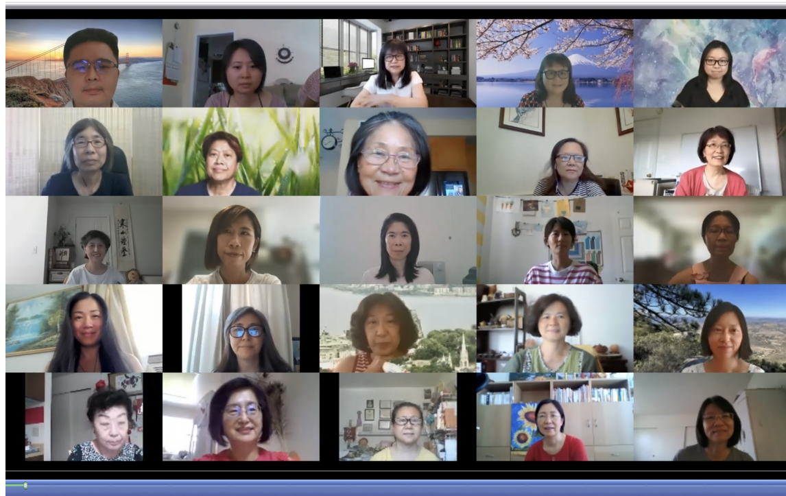
老師網路合照之一。