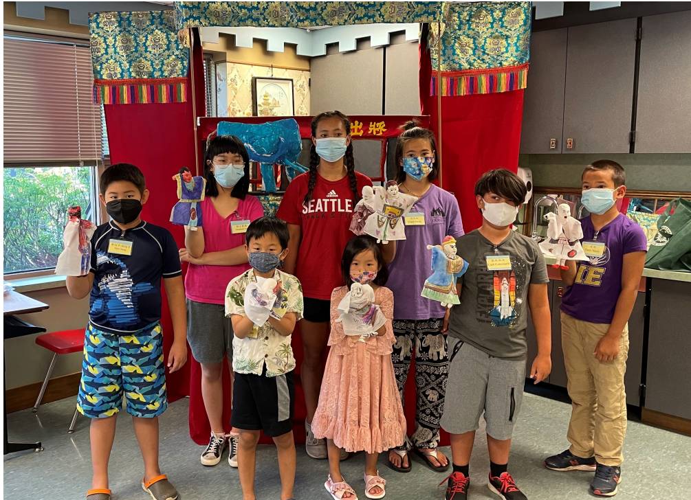
學員自製布袋戲偶。