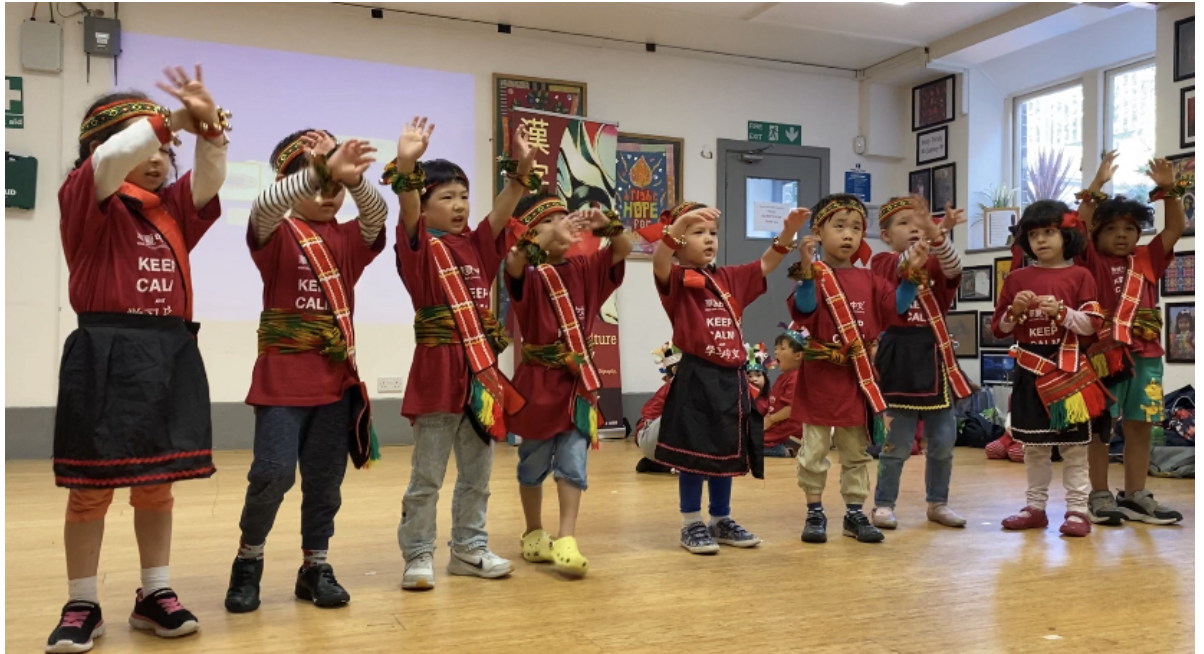
GroupA (age3-4)學習臺灣原住民舞蹈-高山青